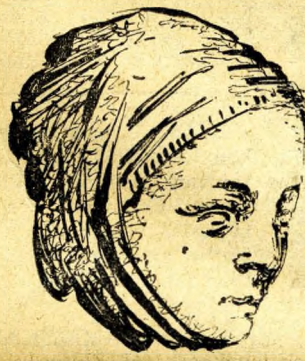
Gótikus szobortörödek a Vár lovagteréből (Vincze Lajos rajzai)

A Hegyalja úton dübörgő autóbuszok alatt, az úttest mélyén egy meleg víz. 27 méter hosszú