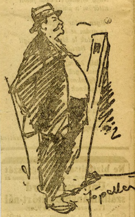
A főpallér dirigál

— Polgári lakások?... Ugyan! — mondja a mérnök. Ki akar ma gyökeret eresztetni, ki boldog ma konyhát, fürdőszobát, kamrát kihasítani a drága telek-