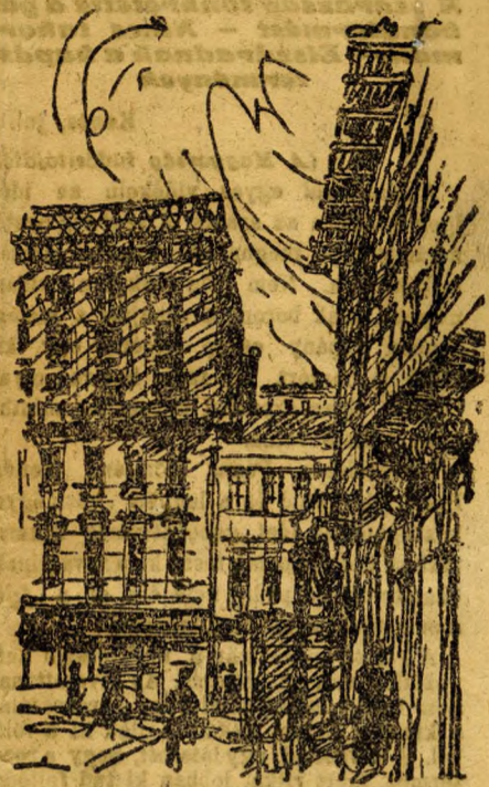
A József-téri két ház, ahol csigák emelték fel a tetőt

női munkaerő: 20 korona óránként; 3 hónap alatt a 40 nő hatszáz ezer koronát kap;