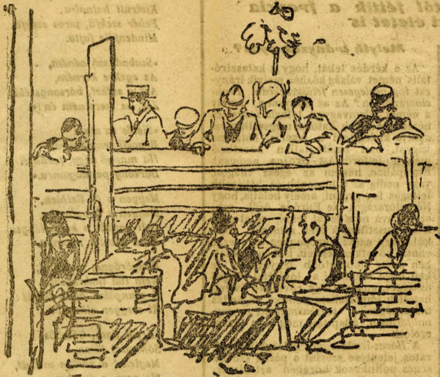
A közösség a palánkon át élvezzi a munkát

ből és a méregdrága anyagból?... Megfizetik azt ma? No ugy-e. Lakásrendelet, rekvirálás, igazolvány, ácsorgás, kidobás, kálvária — ezt jelenti a lakás.