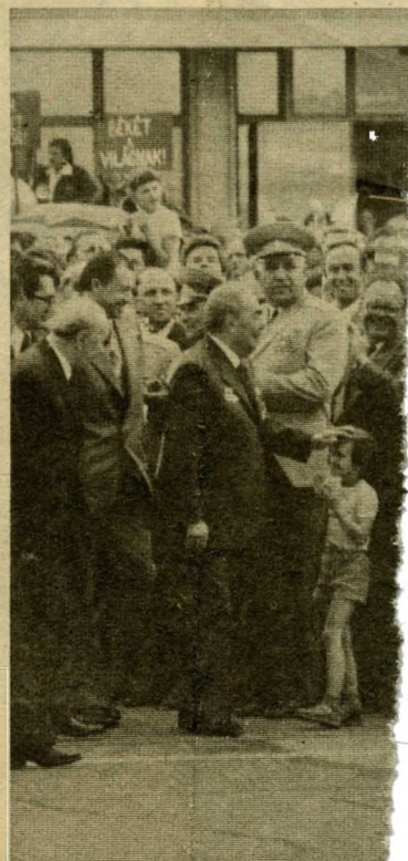
A búcsú egyik kedves pillanata