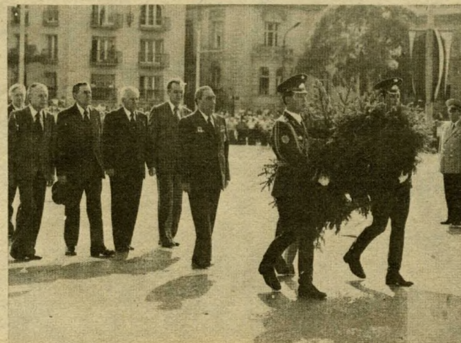
L. I. Brezsnyev és kísérete megkoszorúzta a magyar hősök emlékművét