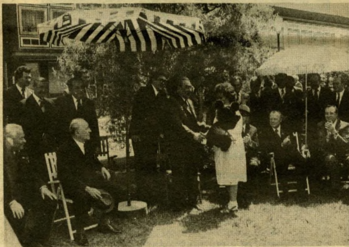
A kelenföldi óvodások kedves műsorát követően L. I. Brezsnyev egy Misa-mackót ad át az óvoda vezetőjének