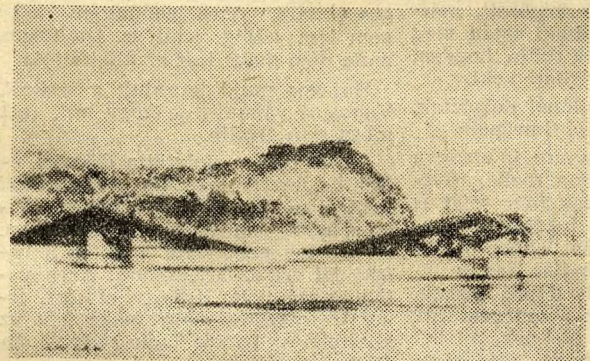
A régi Boráros téri hid roncsai.

1945 január 14-én ismét robbanás reszkettette meg a dunaparti házakat és az oszladozó füstből a Petőfi-