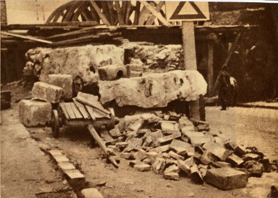
Régi kövek, téglák, melyeket beletépitenek az új bécsi kapuba.