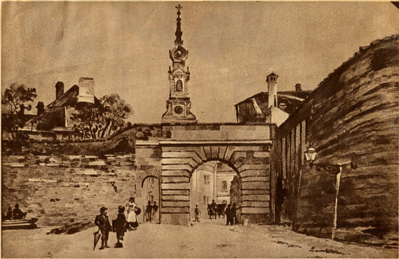
A régi bécsi kapu. A Fővárosi Muzeumban őrzött egykoru vízfestmény nyomán.