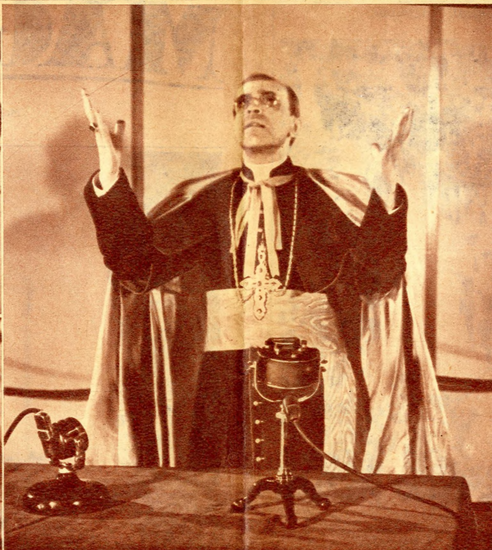
Pacelli bíbornok rádiószózatát tartja