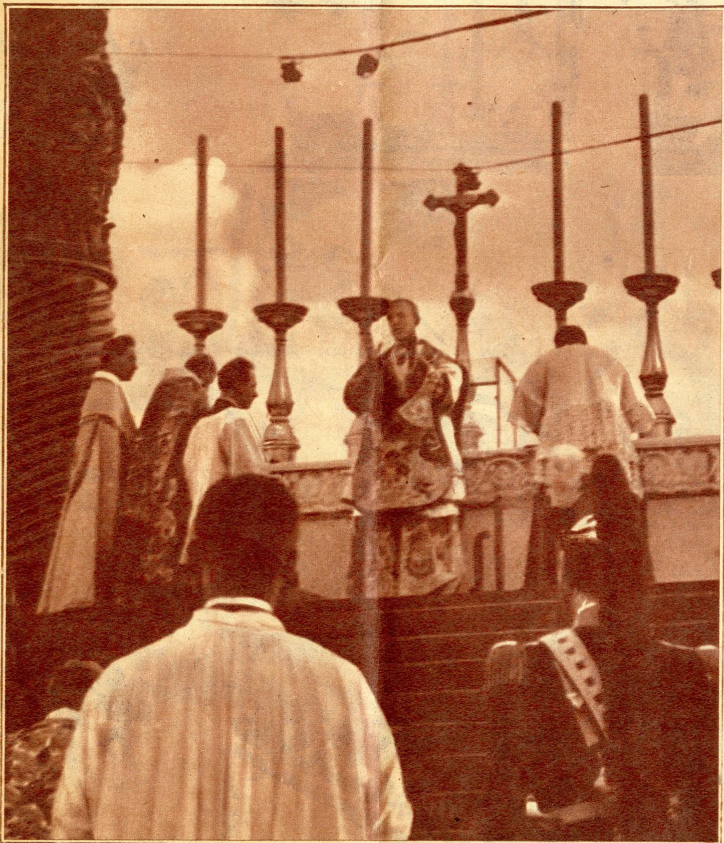
Pacelli bibornok pontifikálja a vasárnap reggeli szentmisét

Melléklet a Magyarság 1938 május 31-i számához (102)