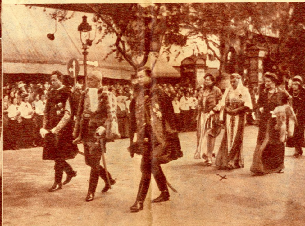
Albrecht, József, József Ferenc főhercegek és a kormányzóné kíséretével