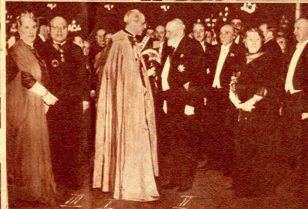
A magyar országgyűlés mindkét házának közös fogadóestje a parlamentben. I. Pacelli bíbornok. II. gróf Széchenyi a felsőház-, III. Korniss Gy. a képviselőház elnöke