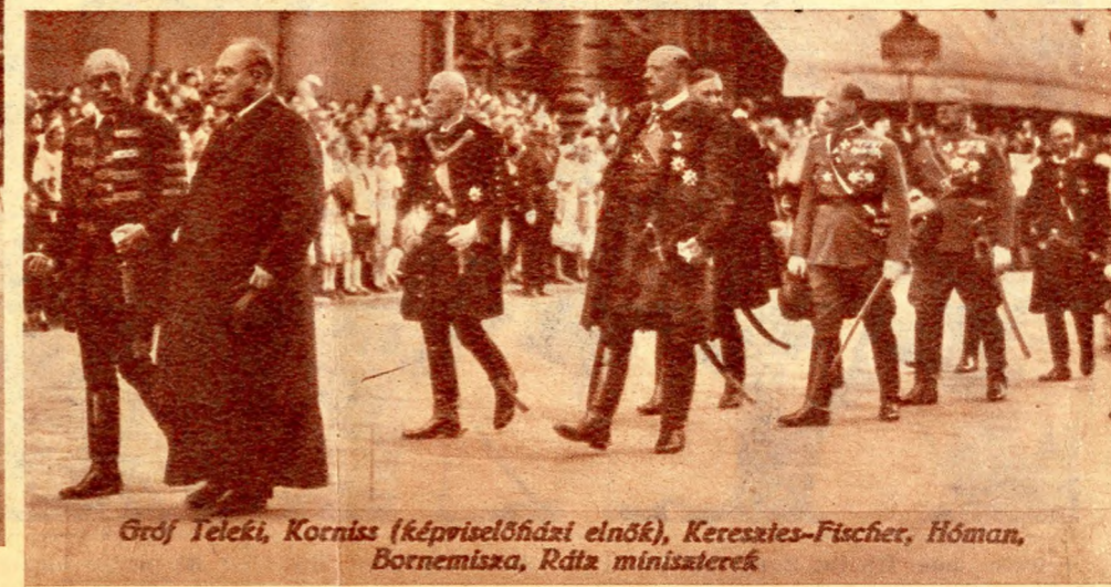
Gróf Teleki, Korniss (képvisezőházi elnök), Keresztes-Fischer, Hóman, Bornemisza, Rátz miniszterek