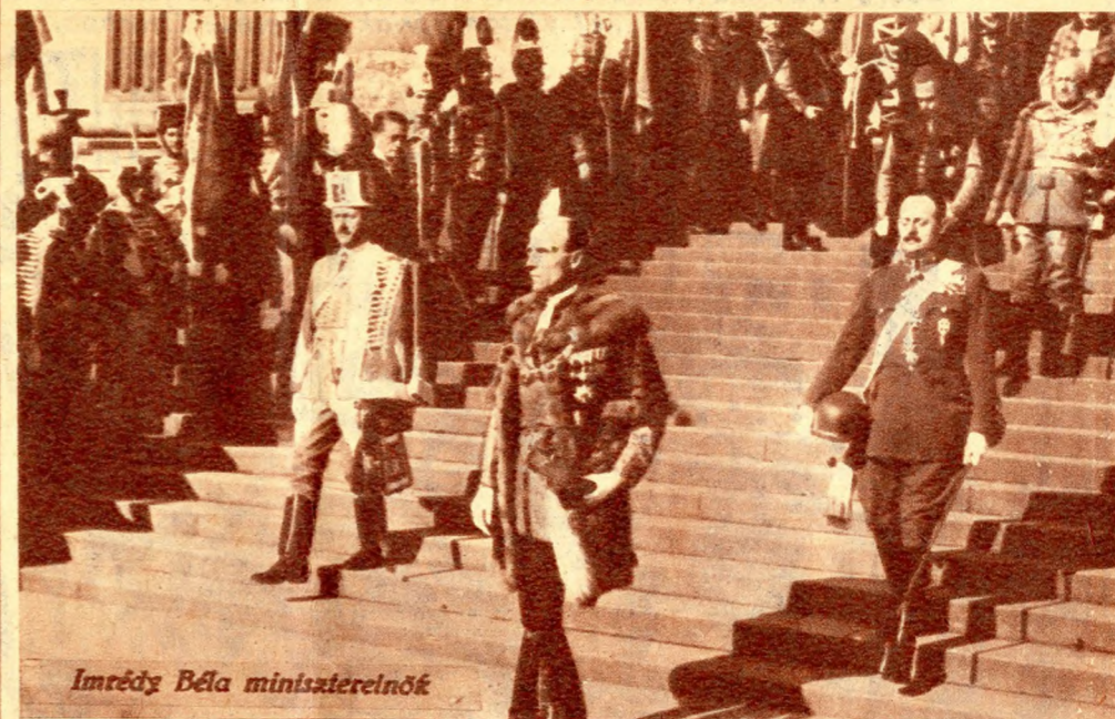
Imrédy Béla miniszterelnök