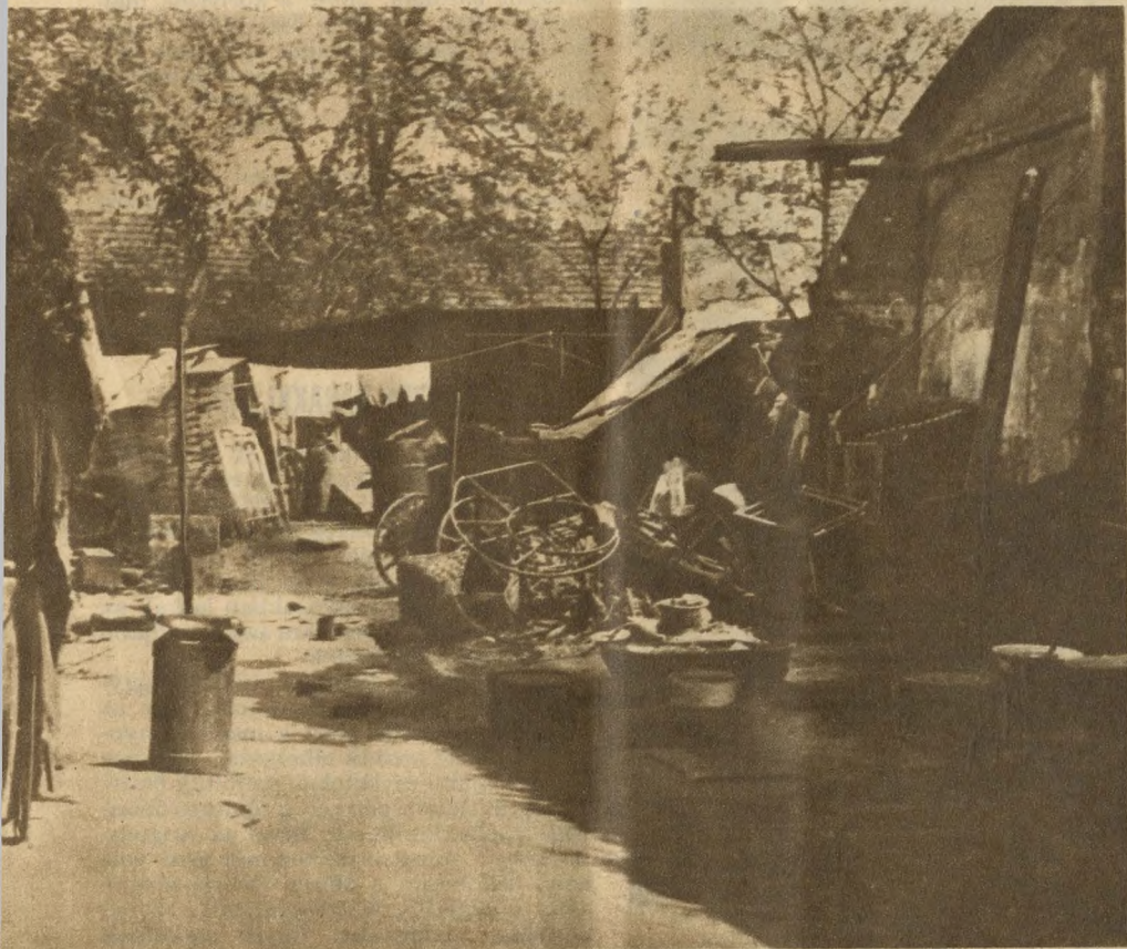
A telep egy részlete