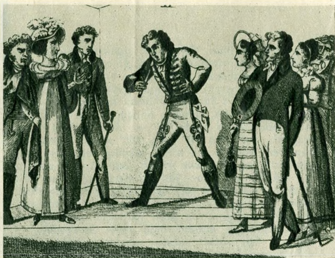
Magyar bűvész a XVIII. században. Első kép: kártyaszemfényvesztés. Második kép: égő gyertyát nyel el a bűvész.