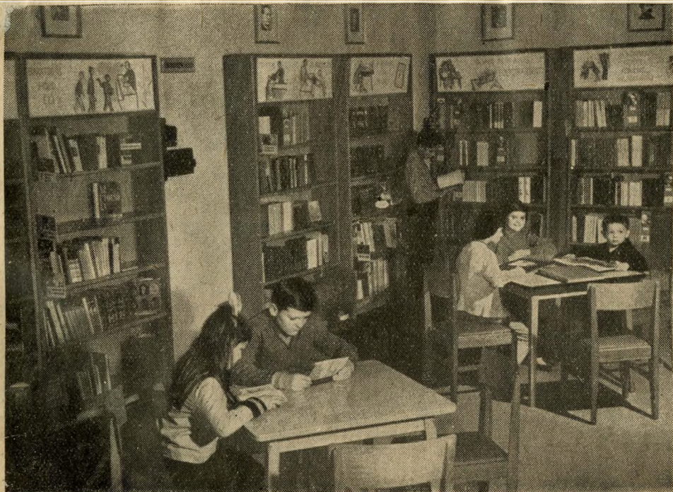
A Főv. Szabó Ervin Könyvtár 4. sz. önálló gyermekkönyvtára a csepeli Csillagtelepen

hogy a kiállítási állvány túl magas, a Kertész utcai könyvtárban ugyanezt a panaszt hallottuk — az év végén. A hálózatnak bátrabban kellene felhasználnia saját jó tapasztalatait (például a Liszt Ferenc téri könyvtár néhány célszerű, ötletes megoldását), és bizonyára nem ártana, ha a Központ a tervezőkkel és az érdekeltektől könyvtárosokkal részletesen megvitatná az eddig szerzett tapasztalatokat.