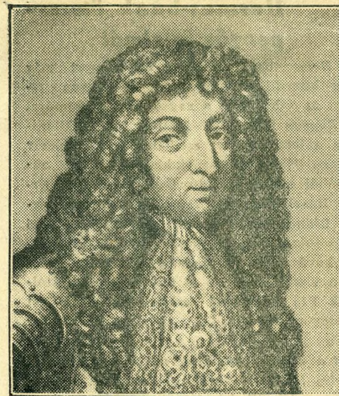
Lotharingiai Károly herceg és