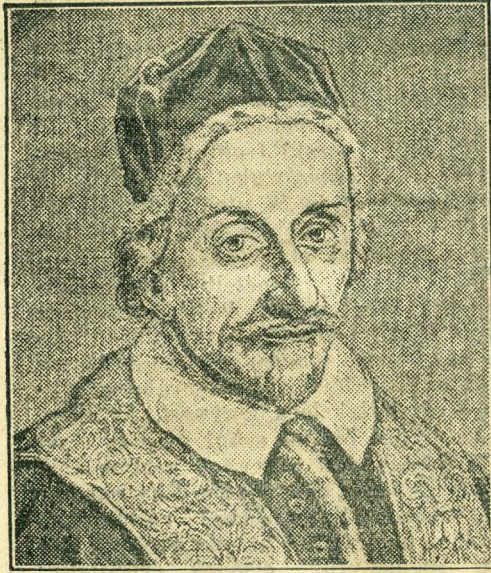
XI. Ince pápa,

XVIII. évfolyam 199. szám ◆ KEDD ◆ Budapest 1936 szeptember 1