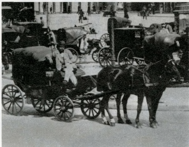
Szepesvári Sándor reprodukciói