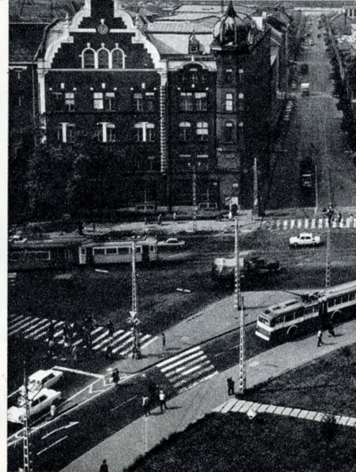
Kilátás a Volga Szálló tetejéről

Az igényekhez képest folytonosan egy helyben topogó angyalföldi tömegközlekedésnek nem egyszerűen a fejlődő ipar, a lakótelepek sora a magyarázata, inkább megoldatlan forgalomrendezési szakkérdésekről van szó. A városrész két főútját sűrűn keresztezik más forgalmas útvonalak, s a Népfürdő utca, a Csavargár utca, a Fóti út, az Élmunkás-híd, a Dózsa György út, a Róbert Károly körút, az Árpád-híd forgalmának is zöldtet kell adni. Emiatt a zötyögő, régi háromkocsis szerelvények és a korszerű villamos motorkocsik egyaránt hosszasan és gyakran feleslegesen kényszerülnek várakozásra. Az Árpád-hídi csomópontnál a minden irányból megengedett forgalom