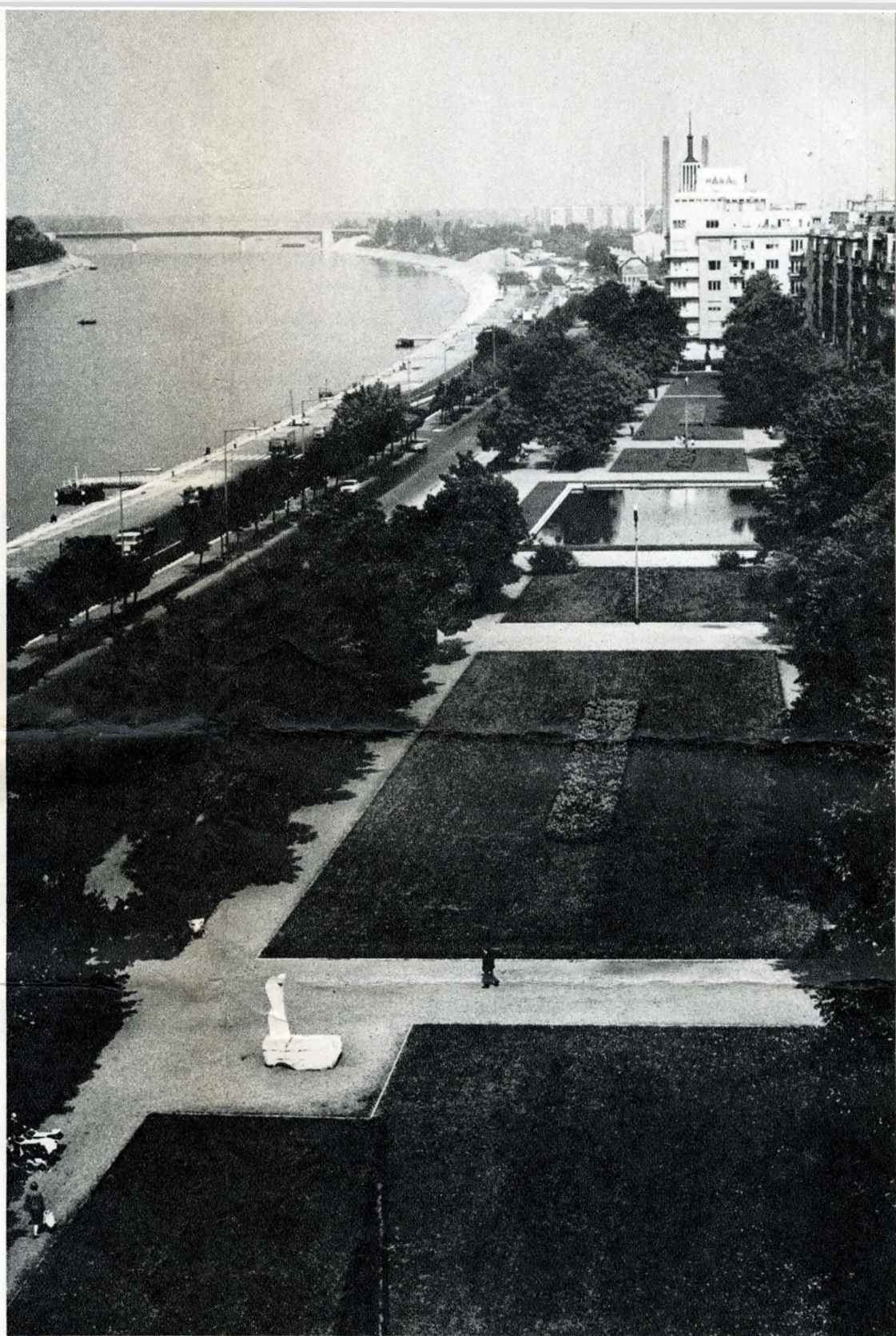
A Szent István park