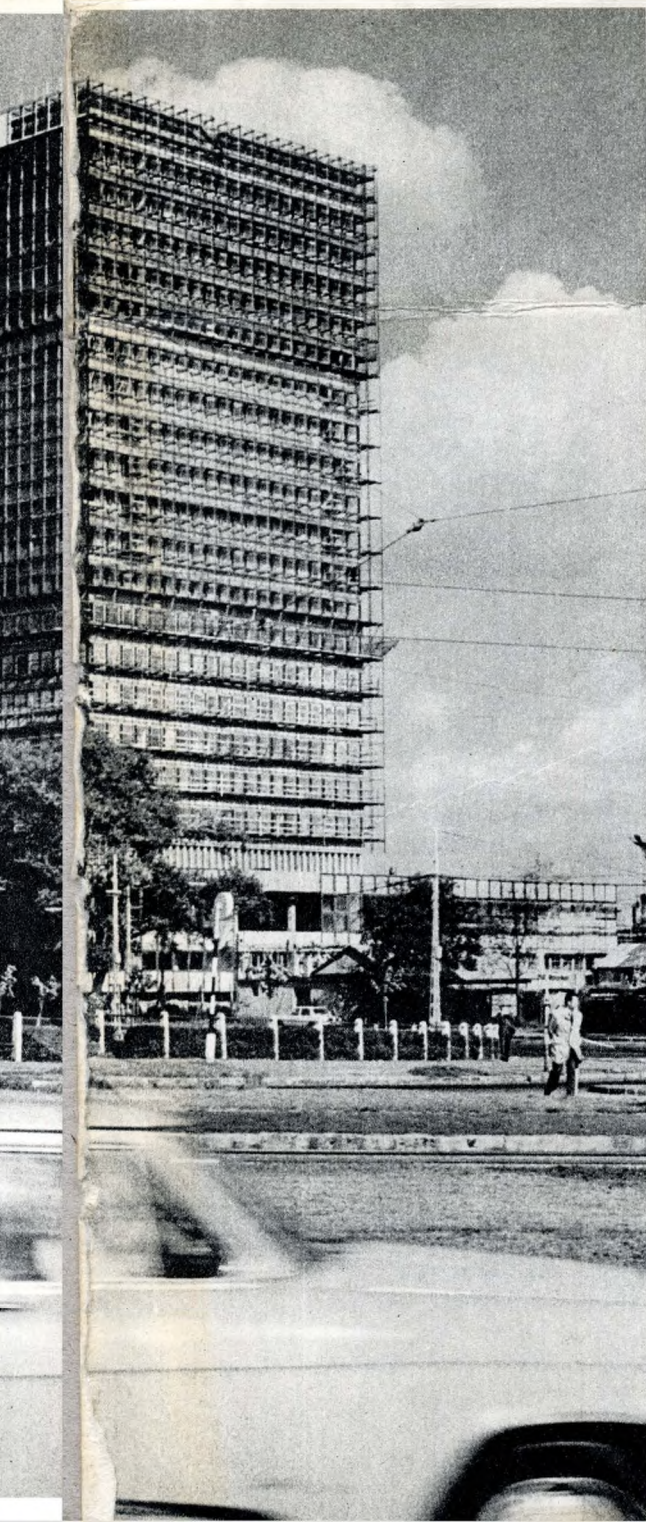
Angyalföld legmagasabb épülete, az Árpád-híd pesti hídfőjével

Mindent összevetve azonban: Angyalföld jelenét, fejlesztésének tempóját, távlatait kedvezően lehet értékelni; a prognózis biztató. Már csak azért is, mert a XIII. kerület népe kedves a fővárosnak, az országnak. Minden bizonnyal megkapja a szükséges segítséget gondjai megoldására.