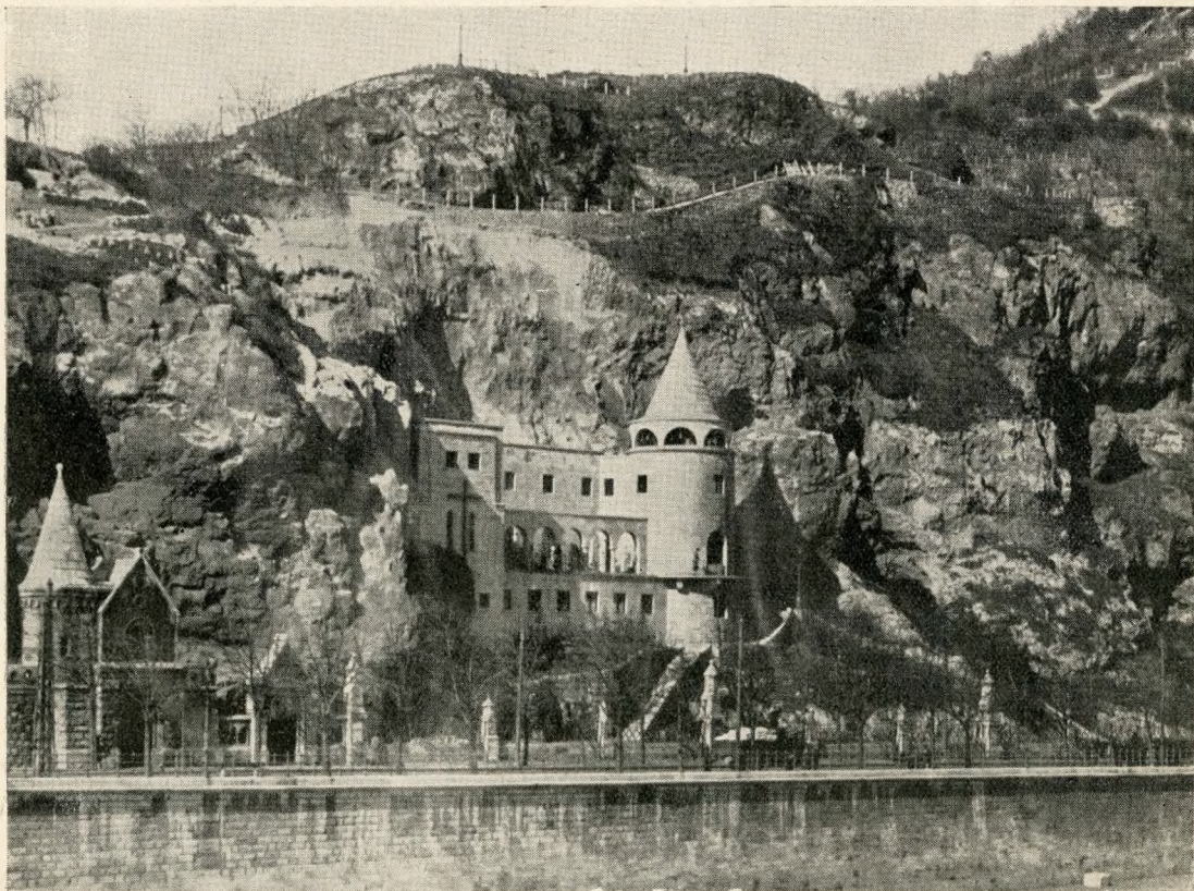
A Pálosok kolostora a Gellérthegyen

nem más, mint a Dávid-zsoltárok cymbalumja , tehát igazi megszentelt hangszer (pedig az bizonyára semleges hangú, triangulum-féle ütőhangszer volt). Több századon át csakis kézben tartott kalapáccsal ütögették a dallamzengő harangsort. Hasonlóan kezelték tehát, mint a pohárjátékot szokták. Arra, hogy gépezet segítségével, mechanikusan zengessék azt, csak a 13. században gondolnak először. Ekkor történik, hogy a mozgatható kalapácsokat a harangok mellé rögzítik és a klastortorony óraművével kapcsolják össze. Az ilyen óra aztán bizonyos időpontokban nemcsak üt, de utána muzsikál is. A kézzel és géppel való megszólaltatás kétféle típusa közt középúton találjuk az olyan harangjátékot, melyen minden egyes harangnak megvan már a külön nyelve , de ezeket még kézzel mozdítják meg. Utóbbiról a