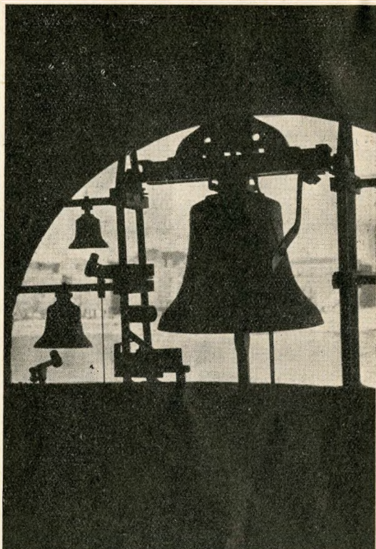
Harangok a toronyban

A lengyelországi számkivetésükből nemrég hazatelepített pálosrendi atyák gellért-hegyi sziklaodujában igazi magyar vendégszeretettel és szerzetesi, sugárzó jósággal fogadják a látogatót. Szerényen elhárítanak minden hálaszót, természetes készséggel mutatják be csengő hangjátékuk berendezését. Billentyűzetes játékukat a pest-erzsébeti «Harangművek»-cég készítette, a harangok öntése — a nemeslelkű adományozások sorrendjében — 1925-től fogva ment végbe. A zongoraszerű billentyűzet játszószekevénykébe van beépítve, ez pedig a klostrom emeleti folyosóján áll. Huszonöt hangra szól a készülék, az «egyvonásos» c-től a «háromvonásos» c-ig terjedő kromatikus hangegymásután szerint. Egyelőre még csak 16 harangot kaptak a pálosok, a hangsorból tehát csak ennyi hang tud megszólalni. Minden billentyűtől külön elektromos huzal vezet ki a remek kilátású harangtorony szélén körben lógó harangokhoz. Minden egyes harang alatt fémszekevény rejti a mágneses tekercset, melynek indítóereje a hozzászerelt mozgatható fémkarra hat ki, a fémkar vége pedig már maga a kalapács. Így magyarázza el mindezt az