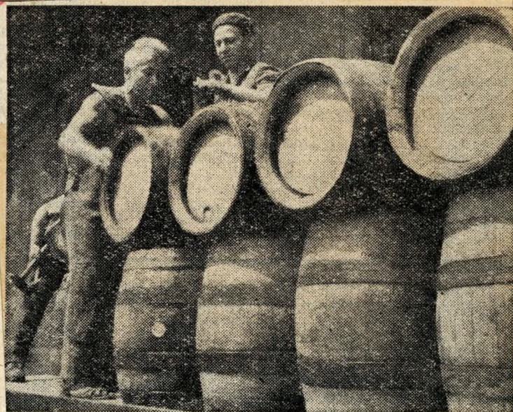
Éjjel-nappal szállítják a hordósört.