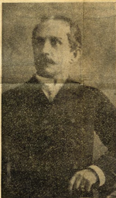
Feketeházy János hidász-mérnök, aki a fenti Eiffel-építette szegedi közúti Tiszahídot és a budapesti Szabadság-hídat tervezte

Tudományával iskolát teremtett, mérnökhallgatóink ma is — sok évtizeddel halála után — számos dolgot tanulnak még úgy, ahogy ő azt lefektette. Néhány még élő tanítványa ma is rajongó szeretettel emlékezik vissza rá, az elmélyült