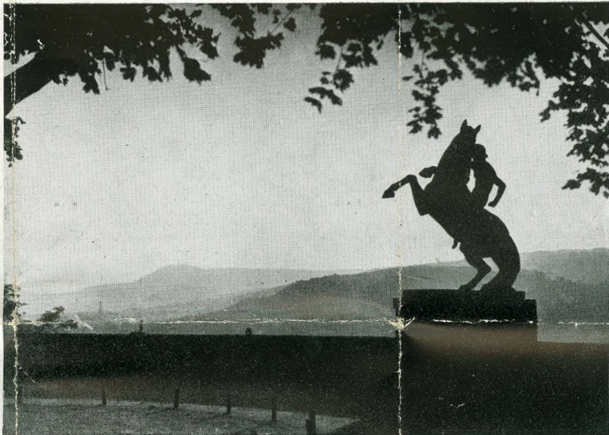
Bástyasétányi kilátás Вид с аллеи бастиона