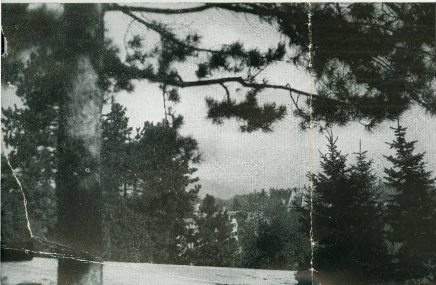
A Széchenyi-hegyi kert Сад на горе Сеченьи The Mount Széchenyi Garden Jardin du Mont Széchenyi

A budapesti parkok azonban még sokáig nem lesznek a régiek. A magnoliákkal, díszfákkal és fenyőfélékkel együtt a faiskolai anyag jó része is elpusztult, hosszú időbe telik, míg a régi növényzet pótolható lesz. Annál jobban meg kell becsülni azt, ami megmaradt. A kert nem építmény, amely határidőre készül, ki-fejlesztéséhez, lelkének, hangulatának kialakulásához hosszú évek kellene.