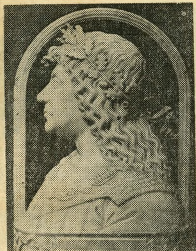
Gion Christoforo Romano: Matyas (1490).