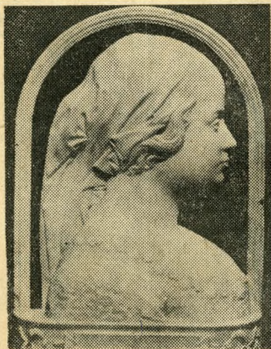
Gion Cristoforo Romano: Beatrice (1490).