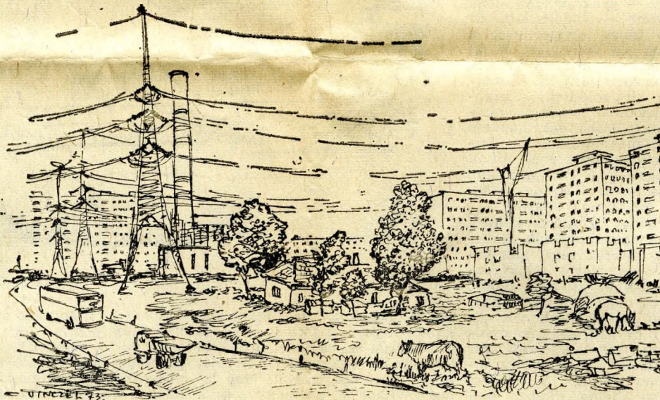
(Vince Lajos rajza)

Ami szinte állandósult alfejezetnek mondható: az ipar szívesebben települt a kommunális ellátottság színvonalában előkelőbb helyezésű Újpestre, mintsem Palotára. Az itt élők zöme így ma is a főváros más kerületében dolgozik; amennyiben valahol elhatározzák, hogy valamit „kiköltöztetnek” Rákospalotára, úgy többnyire raktárakról esik szó. Nemcsak a Domus nevű bútoráruházra gondolok; a minap a MEGEV , a Mezőgazdasági Alkaterész Ellátó Vállalat székháza előtt az akasztói szakszövetkezet gépkocsi-vezetőjével futottam össze. (Az egész ország mezőgazdasági tudják, hogy ez a cég Palotán lehétő meg, a Cservenka úton, szemben Újpalotával.) A kerületen belüli két városrészt csakugyan roppant mód heterogén lakosságának együvé kovácsolása, persze, nem megy már holnapra, sőt egyik évről a másikra sem. Mondhatni azonban: olyan, a gyors ütemű fejlődésből következtet adottság ez, amelyet lehet, s amelyet — úgy tapasztaltam — szívós türelemmel máris formálni tudnak a kerület irányítói.