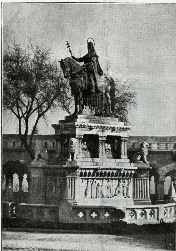
Budapest - La statua equestre di Stefano I Re d'Ungheria

È soltanto in base alle vicende storiche, infatti, che si può capire la stranezza suggestiva della struttura di Budapest, la magnifica metropoli magiara dal rigoroso binomio, dominatrice del Danubio. A voler guardar brevemente indietro si trova che è il Cristianesimo che col suo grande afflato innovatore morale e materiale dà nei più lontani secoli alla città del «Duna» il destino e la forza di costruirsi, di rinforzarsi per resistere e vin-