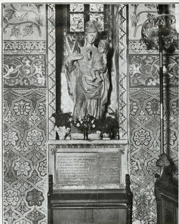
Budapest - Chiesa dell'Incoronazione La statua della Madonna di Loretto apparsa ai Turchi nel 1500

Ho creduto opportuno seguire le grandi linee della travagliata storia ungherese, perchè così meglio si possa sentire e capire l'anima e la fisionomia di questa capitale immensa adagiata sulle due rive del Danubio ceruleo, una, in due città sorelle. Pest antica e novissima, tutta fragori e splendori di modernità e ritmi febbrili di vita e Buda sulle alture maliose, sognante ve-