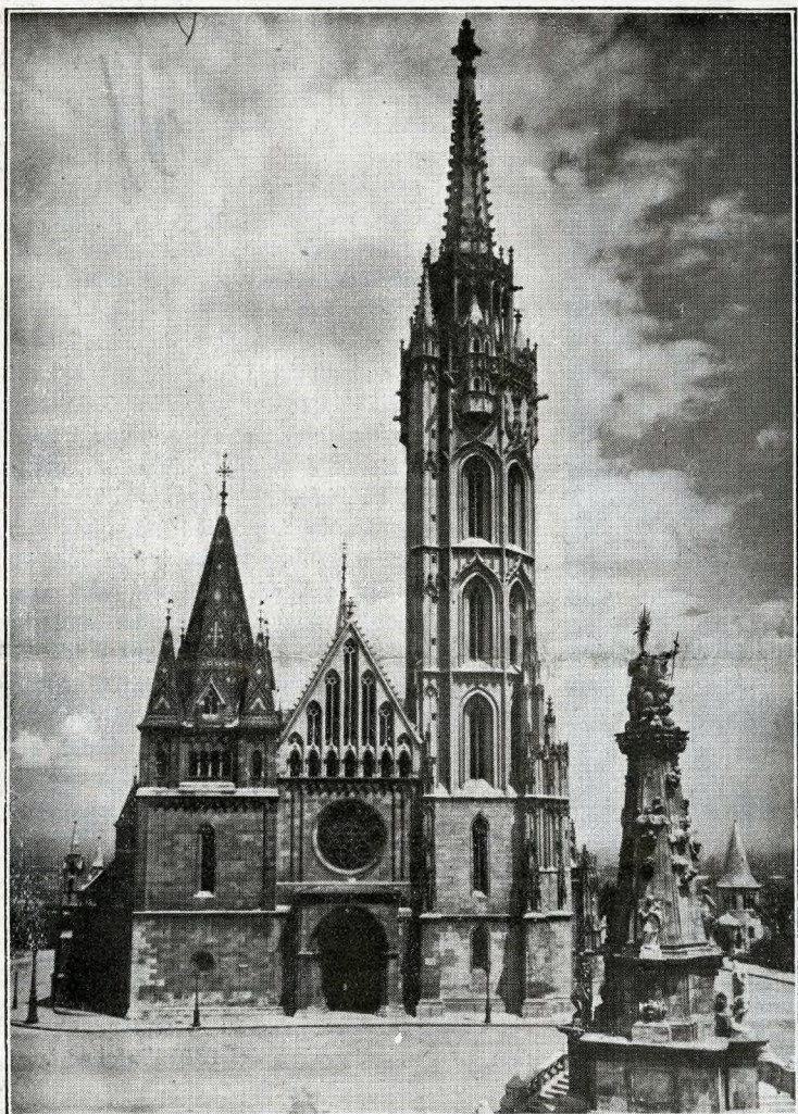
Budapest - Facciata della Chiesa dell'Incoronazione col campanile di Mattia Corvino