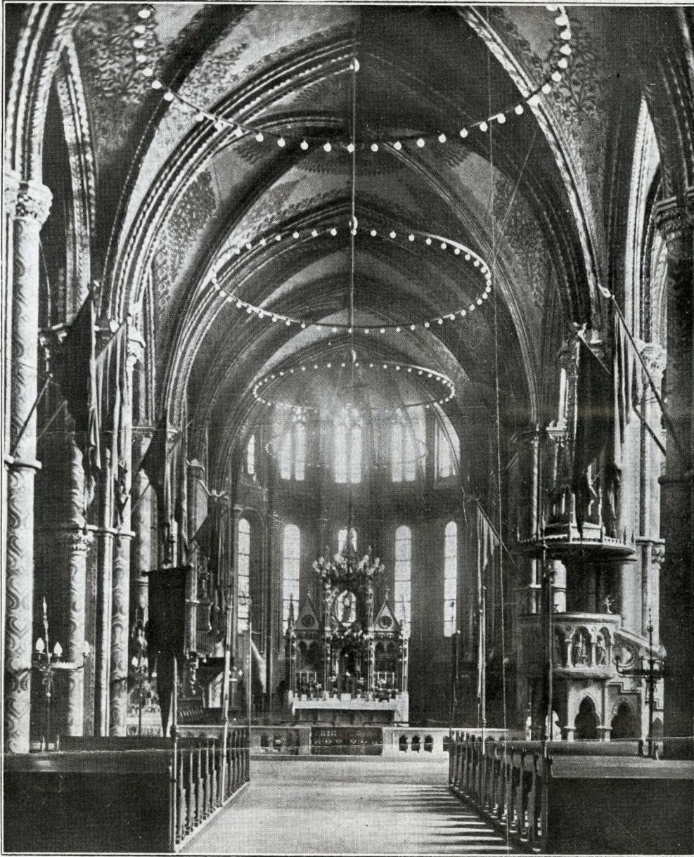
Budapest - Chiesa dell'Incoronazione - Veduta della navata centrale

stale, ricca di splendori non del tutto spenti. Alta città silenziosa, vigile sul fiume possente, adorna di monumenti bellissimi, tra i quali spicca la mole armoniosa del Koronázó Templom, cuore del gran cuore magiaro, cui è legata, come a monumento nazionale, tanta parte della più pura storia ungherese.