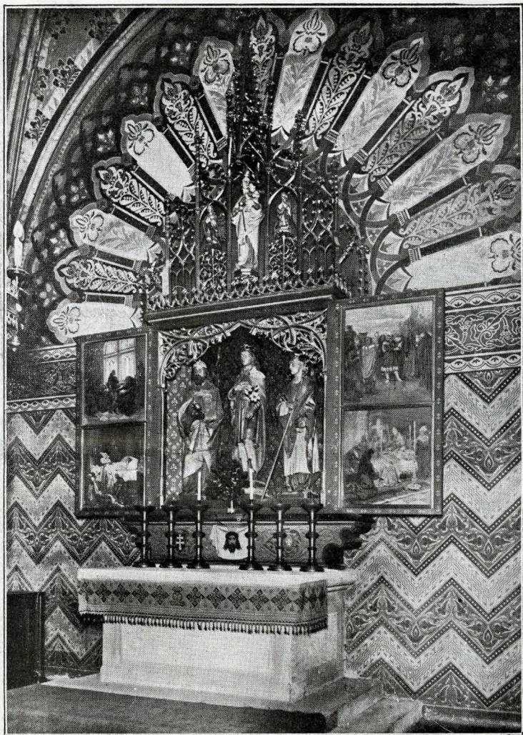
Budapest - Chiesa dell'Incoronazione - Altare di S. Ladislao

cere. Quanto cammino dalla prima colonia Romana di Aquincum del primo secolo di Cristo ai tempi moderni, che hanno compiutamente trasformato la città di Arpad e di Santa Elisabetta, di Mattia Corvino e di Szèchenyi, di Ferenc Liszt e di Kossuth Lajos, di Francesco Giuseppe e dell'Ammiraglio Horty... in una delle più moderne, ricche e interessanti capitali europee.