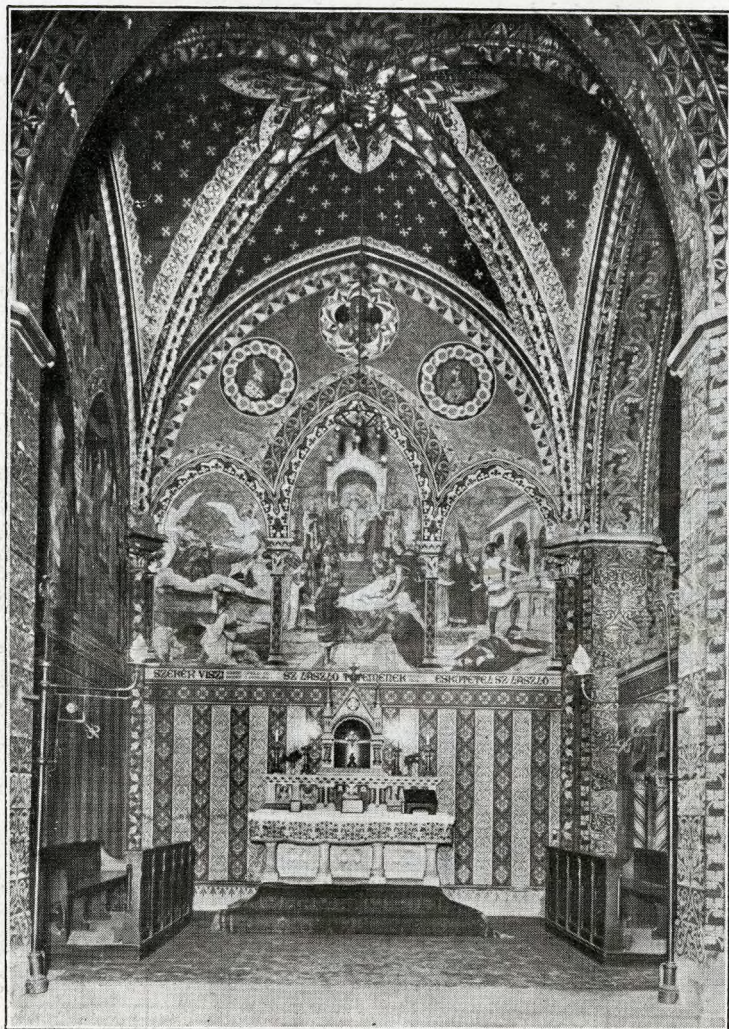
Budapest - Chiesa dell'Incoronazione - Altare di S. Emerico