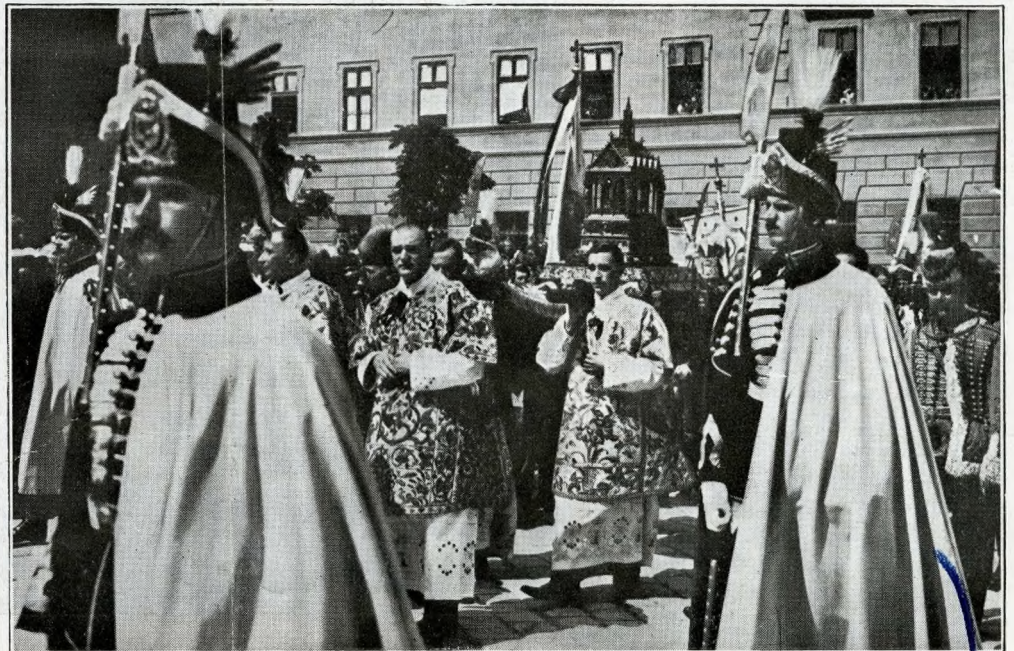
L'annuale processione del 20 agosto a Budapest con la reliquia della mano destra di Santo Stefano