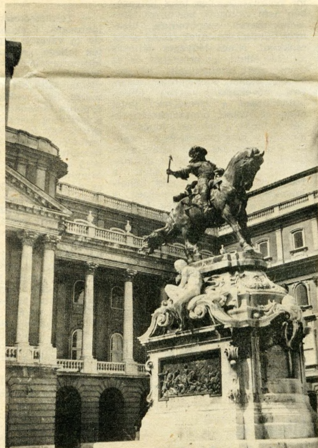
Egy sikeres hadvezér: Savoyai Eugén