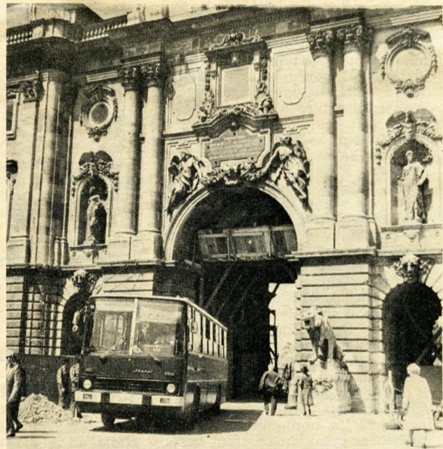
Az oroszlános kapu