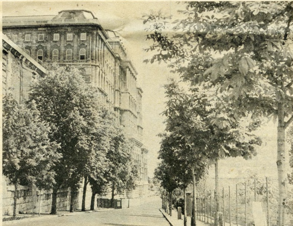
Ide költözik az Országos Széchényi Könyvtár