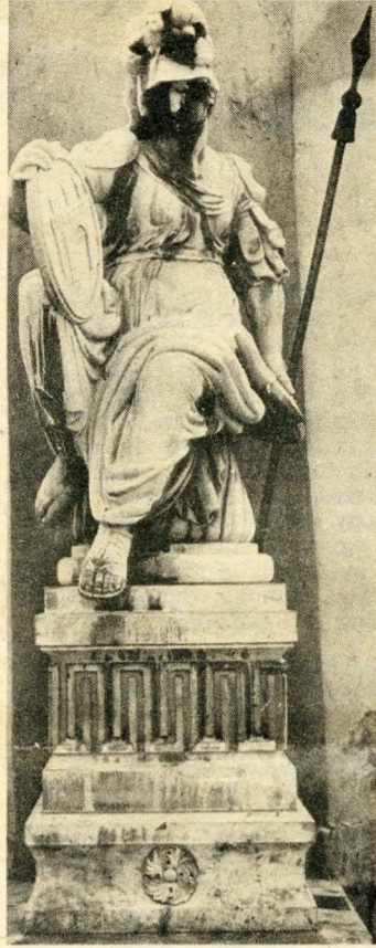
Pallas Athéné szobra