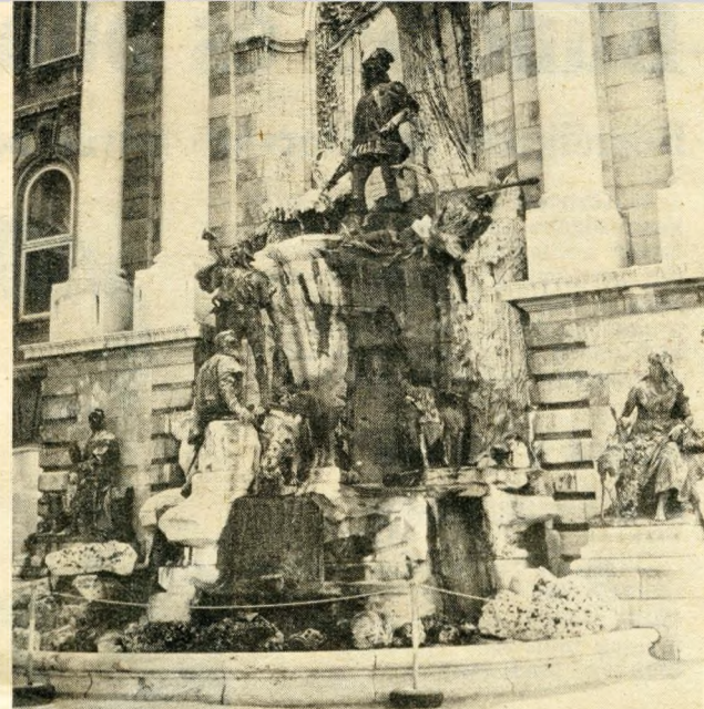
Mátyás király kútja