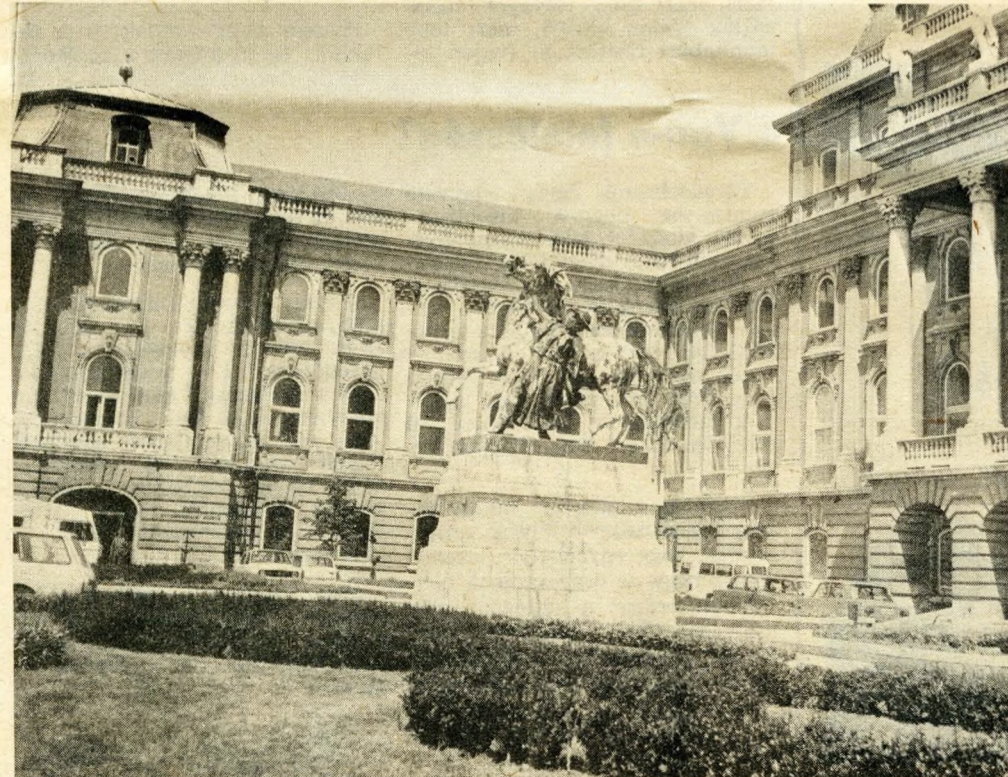
A csikós szobrot nemrég állították fel