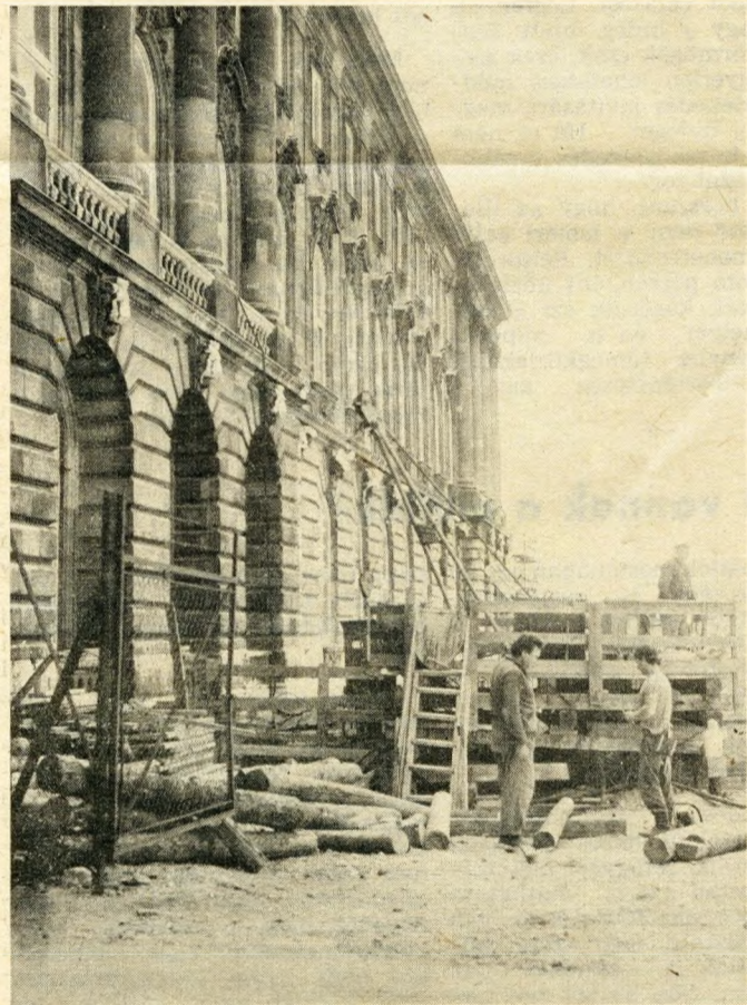
Még folynak a munkák a Széchényi Könyvtár épületén