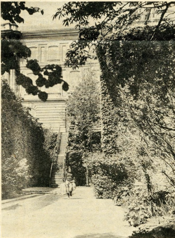
A Nemzeti Galéria és a várkert