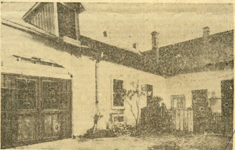
A Kacska utcai műhely képe: 1878