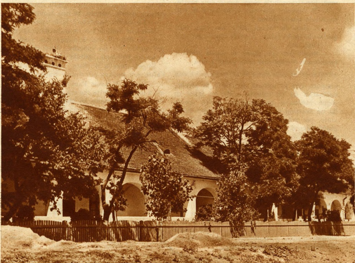
La casa del bandito gentiluomo Sandor-Rözsä.