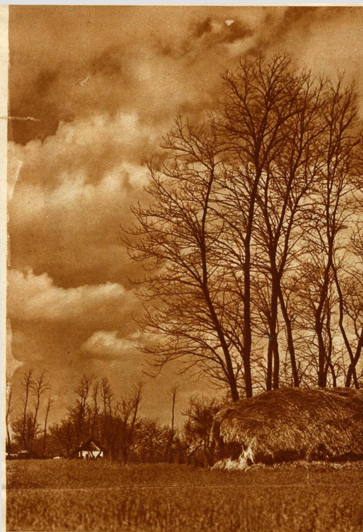
Boschi e capanne.

Sandor Rózsa, d'altra parte, al tempo della guerra d'indipendenza del 1848, organizzò, con i suoi uomini, una squadra libera che combatté con brillante eroismo, tanto che il governo finì per accordare l'amnistia generale a tutti gli antichi briganti. La casa di Rózsa, abitata dai suoi discendenti, esiste ancor oggi.