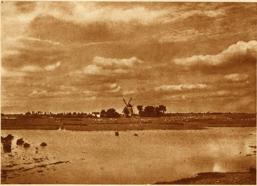
La sterminata e romantica pianura ungherese.