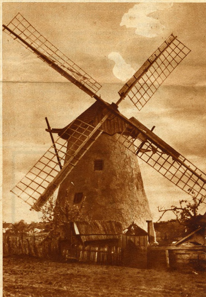
Mulini a vento della pianura bellissima ungherese.

Quale sia la verità s'ignora ancor oggi: è tuttavia certo che il sepolcro di Gül-Baba, sulla collina delle rose è un monumento pittoresco e l'ultima prova in occidente dell'antica potenza mondiale dell'Islam.