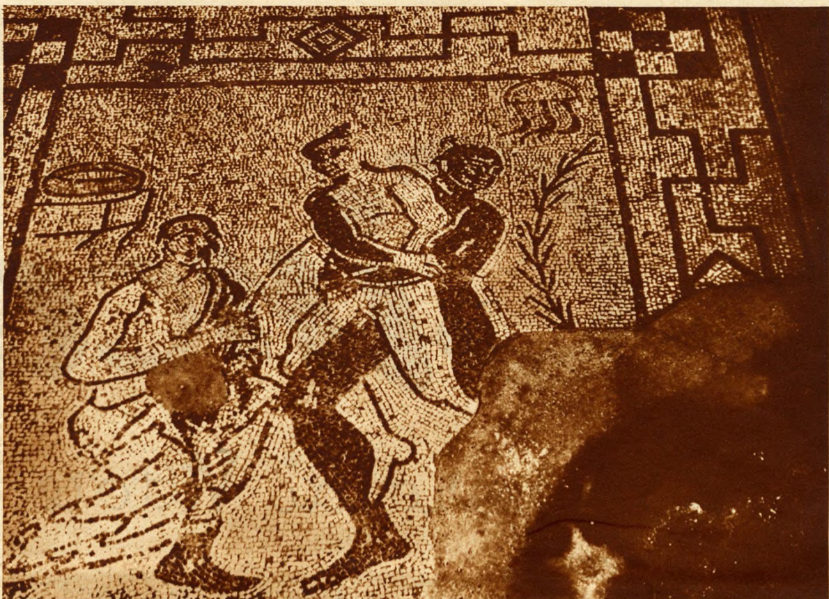
Interessanti ricordi di un incontro di boxe, avvenuto 17 secoli addietro, tra due pancraziasti.

La tomba dello scrittore del Tibet: Kőrösi-Csoma a Dardgiling, non lungi dalle cime ricoperte di neve dell'Himalaya, la terra dei suoi sogni.