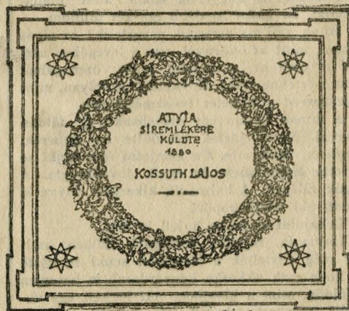
rajzolta: dabasi Halász János

KOSSUTH KÖZSÖRŰ A DABASI REFORMÁTUS TEMPLOMBAN A HALÁSA MŰHELYESEN FÜLKEBEN.