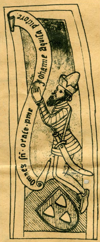
A martyánczi freskó Aquila János festő képével 1392-ből

Elzászban a hatalmas Rappolstein birodalmi grófok azonos cimert használtak és e gögös oligarcha család restellte, hogy építésszel azonos cimert visel, ezért a Juncker testvéreket cimertörőlésért perbe fogták. A per Zsigmond császár legfőbb bírói széke elé került, ki 1414. év július 7—14. napjai között Strassburgban tartózkodott. A császár döntése a Junckereknek kedvezett, amely szerint a hárompajzsos cimernem művészek cimere is lévén, a Juncker testvérek jogosan használhat-