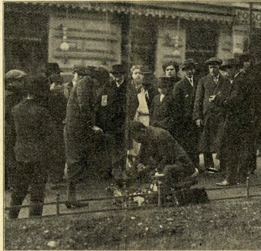
Ein Türke, den der Krieg nichts angeht. Stiefelpuzer in Ofenpest.