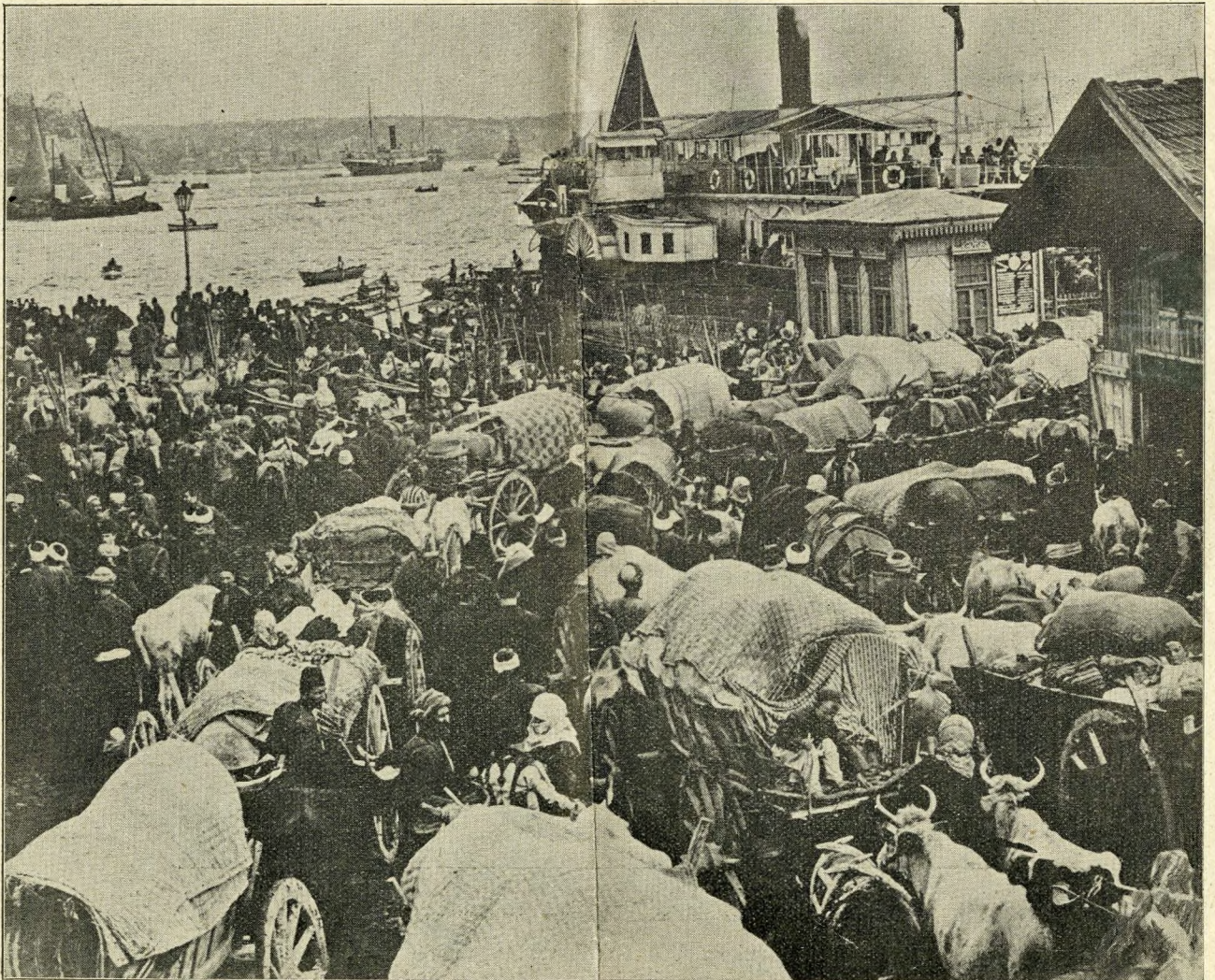
Flüchtlinge an den Quays der Fähre von Konstantinopel warten auf ein Übersetzen nach Klein-Asien, wohin die türkische Regierung, die in Konstantinopel in unübersehbaren Scharen eintreffenden Flüchtlinge abschiebt, weil die Stadt zu klein wird.

Ofenpest macht, wie schon eingangs angedeutet, auf den Fremden ganz den Eindruck einer Großstadt von kontinentaler