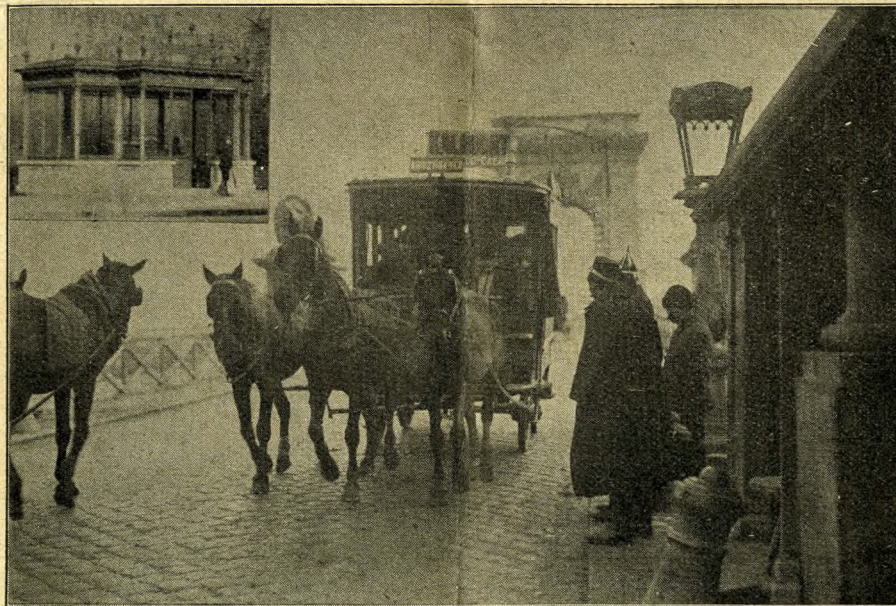
Ein Omnibus passiert die Mautstation auf der großen Kettenbrücke zwischen Ofen und Pest. Oben links die Wartehalle für das Straßenbahnpublikum.

und die die Geschichte unter dem Namen Aquineum bezeichnet. Schon im 13. Jahrhundert hatte es sich zu einer, für damalige Verhältnisse bedeutenden Stadt entwickelt, nicht zuletzt infolge der Rührigkeit einer Gruppe deutscher Kolonisten,