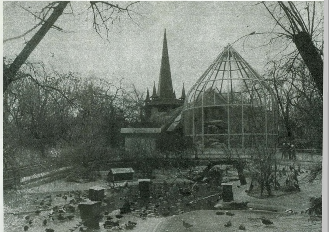
A Kós Károly tervei alapján készült madárház messziről jól mutat, de fenntartása ebben a formában szinte megoldhatatlan

mint kétmillió látogatóval számolhat. Tizenegymillió népességünket tekintve ez rendkívül nagy szám és méltán megérdemli a figyelmet.