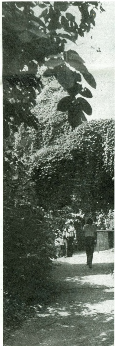
A farkasház mesterséges romjai akadályozzák a korszerűsítési munkákat

állatkertek tizezrekkel, a nagyobbak száz-ezrekkel több látogatót fogadnak évente. Például a moszkvai állatkert 1978-ban 3,5, a frankfurti hárommillió látogatót fogadott, a növekedés ütemét figyelembe véve pedig 1985-re ötmillió látogatót várnak.