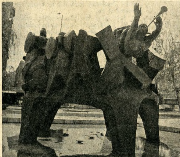
Fent: az északi erődfall és a kiugró torony maradványai a romkertben