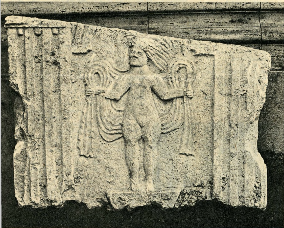
A „pesti Vénusz” – a tavalyi ásatás során előkerült dombormű