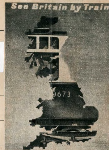
Abram Games: Az angol vasut plakatja