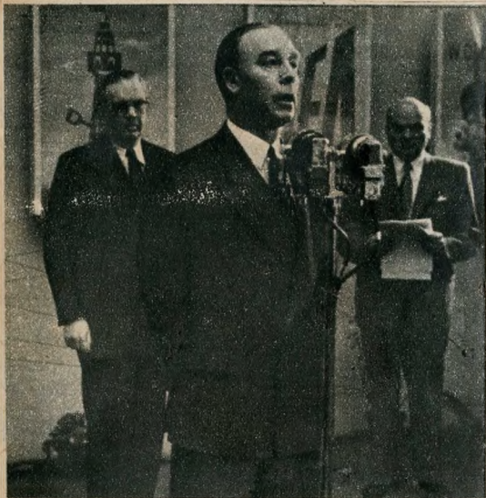
L. A. C. Fry, angol nagykövét beszédet mond a kiállítás megnyitóján