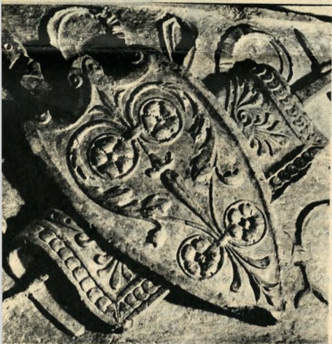
A budavári palota