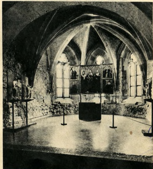
A helyreállított várkápolna