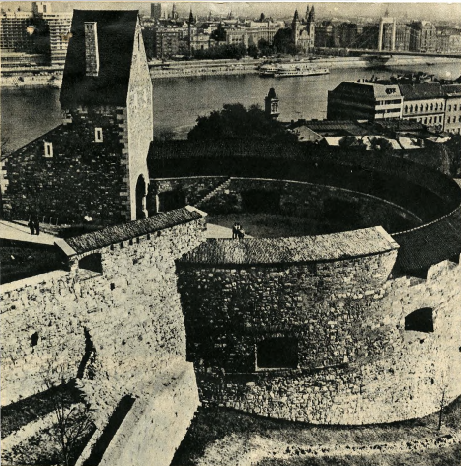
A nagy rondella