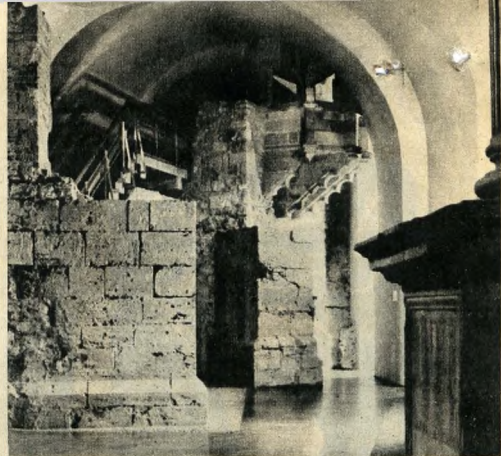
Az egykori várkápolna a feltárás után

Szólnunk kell azokról az épületekről is, melyek a palotától északra, a Szent György téren és a Színház utcában állnak. A várpalotától északra fekvő terület a piactér volt, itt végezték ki Hunyadi Lászlót. A tér keleti oldalán laktanyák álltak, ezek felhasználásával, az 1800-as évek elején épült klasszicista stílusban — lehet, hogy Pollack Mihály tervei szerint — a Sándor-, később Miniszterelnökségi palota. Tovább haladva a várnegyed felé, a Színház utcában áll a Karmelita rend 1730-as években emelt temploma és rendháza. A középkorban a ferencesek kolostora állt itt, a törökök dzsámiá alakították át. A romokon fel-