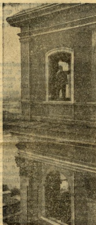
Elhelyezik az ablakokat a galéria új épületében.