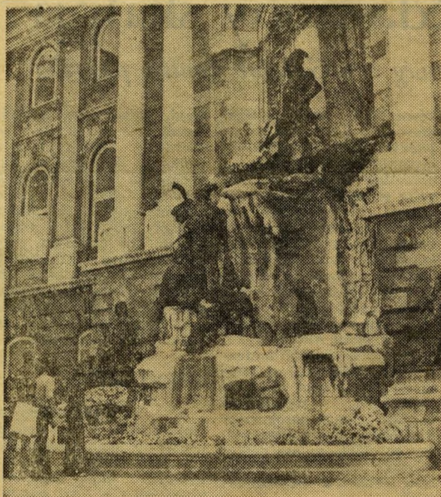
A budavári palota „láthatatlan” homlokzata. Csaknem kész Mátyás kútja, amely megsérült a háborúban.

Itt Buda vára épül újjá. Aczél Kovách Tamás