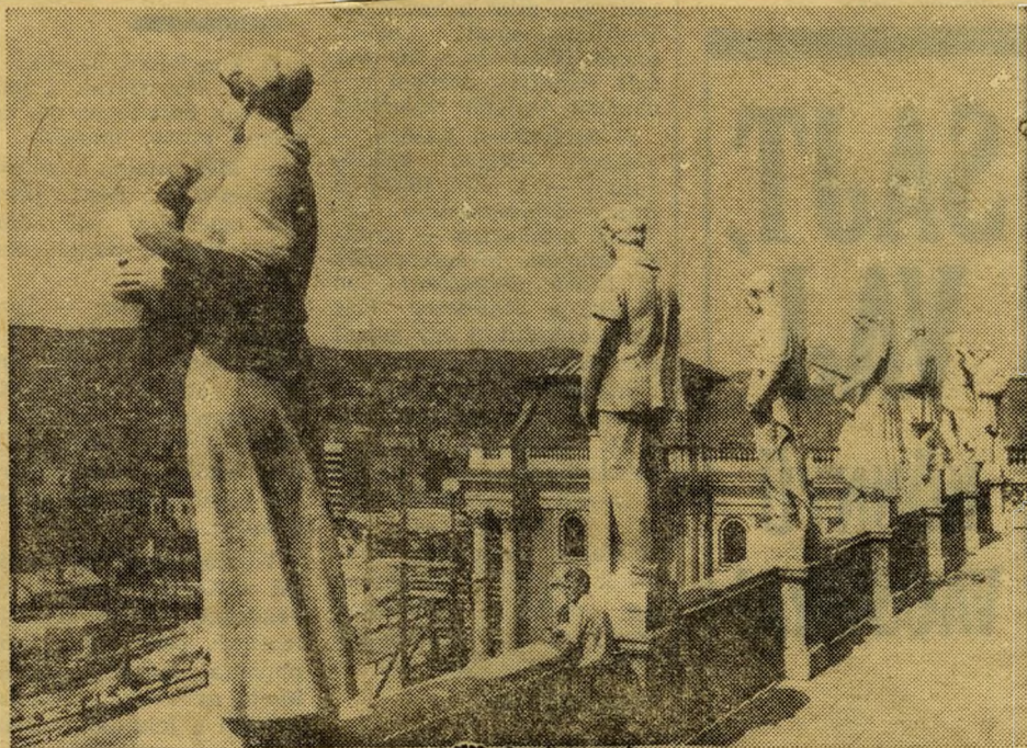
Kilátás a hegyek felé a Nemzeti Galéria új otthonának már átadott erkélyéről.

A látogatók, amikor megállnak a déli bástyán, az István-torony mellett, a gótikus nagyteremben vagy a kápolnában, akkor értik