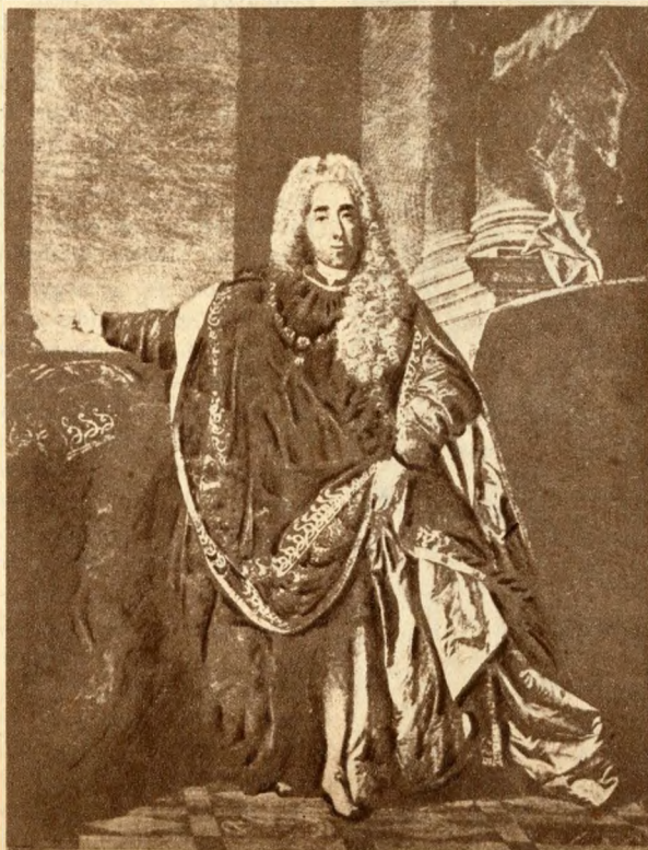
Savoyai Jenő herceg. (Van Schuppen festménye.)

augusztus 13-án együtt nyerték meg s közös győzelem volt az Oudenaard-nál aratott győzelem 1705-ben. Vendôme francia tábornokot azonban Cassanonál 1705-ben Jenő herceg verte meg. Toulon-nál Villars-ral szemben csatát vesztett, de Franciaország ebben az időben már annyira kimerült s a két nagy hadvezér annyi győzelmet aratott, hogy XIV. Lajos hadserege régi erejét többé vissza nem nyerhette. Az 1715-iki rastatti béketárgyalásokon ő képviselte a császárt és ő írta alá a békeszerződést. A közel másfél évtizedig tartó élethalálharc, a Franciaország ellen szövetkezett hatalmak győzelmével végződött. A pénzügyileg, katonailag tönkrement Franciaország aránylag igen jó békét kötött. Ausztriának a győzelemből nem volt sok haszna, de annál nagyobb haszna volt Angolországának, amely kihasználta a Franciaországon aratott győzelmet gyar-