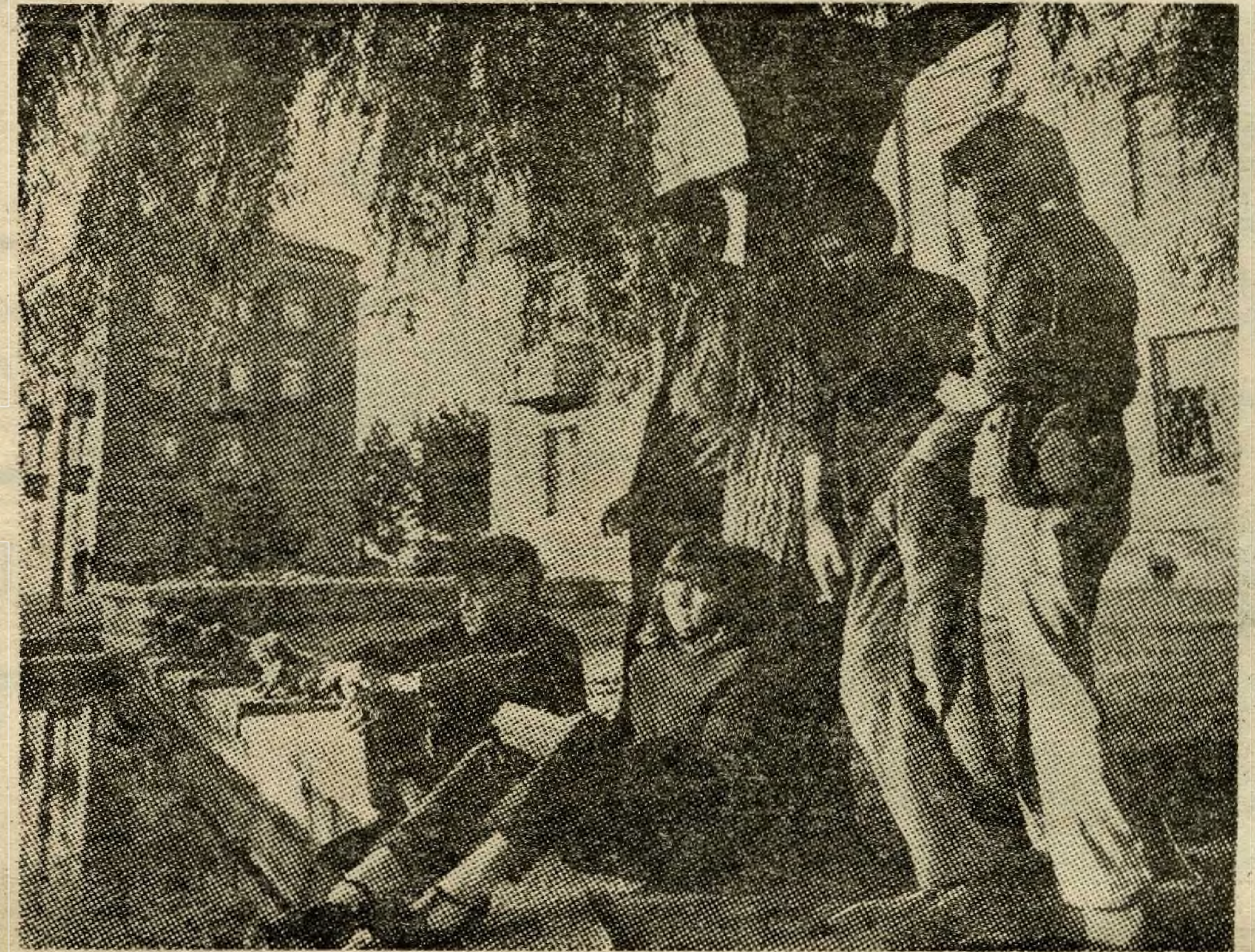
Zelfs de beatfans in Hongarije verschillen in generlei opzicht van hun tijdgenoten in andere landen.

DE hervorming die begin 1968 werd gelanceerd moest de oorzaken van deze malaise uitroeien. De gevolgen beginnen zich nu te tonen. Door deze hervorming komt de totale verantwoordelijkheid opnieuw te liggen op de schouders van de directeurs der ondernemingen en coöperatieven wat betreft de programmatie van hun produktie. Zij krijgen volmacht om hun verkoopsnetten uit te bouwen en de prijzenpolitiek wordt bepaald op het niveau van de onderneming. Dat is bepaald revolutionair voor een communistisch systeem, want het is vrijwel een complete terugkeer naar de vrije markteconomie. Het plan-