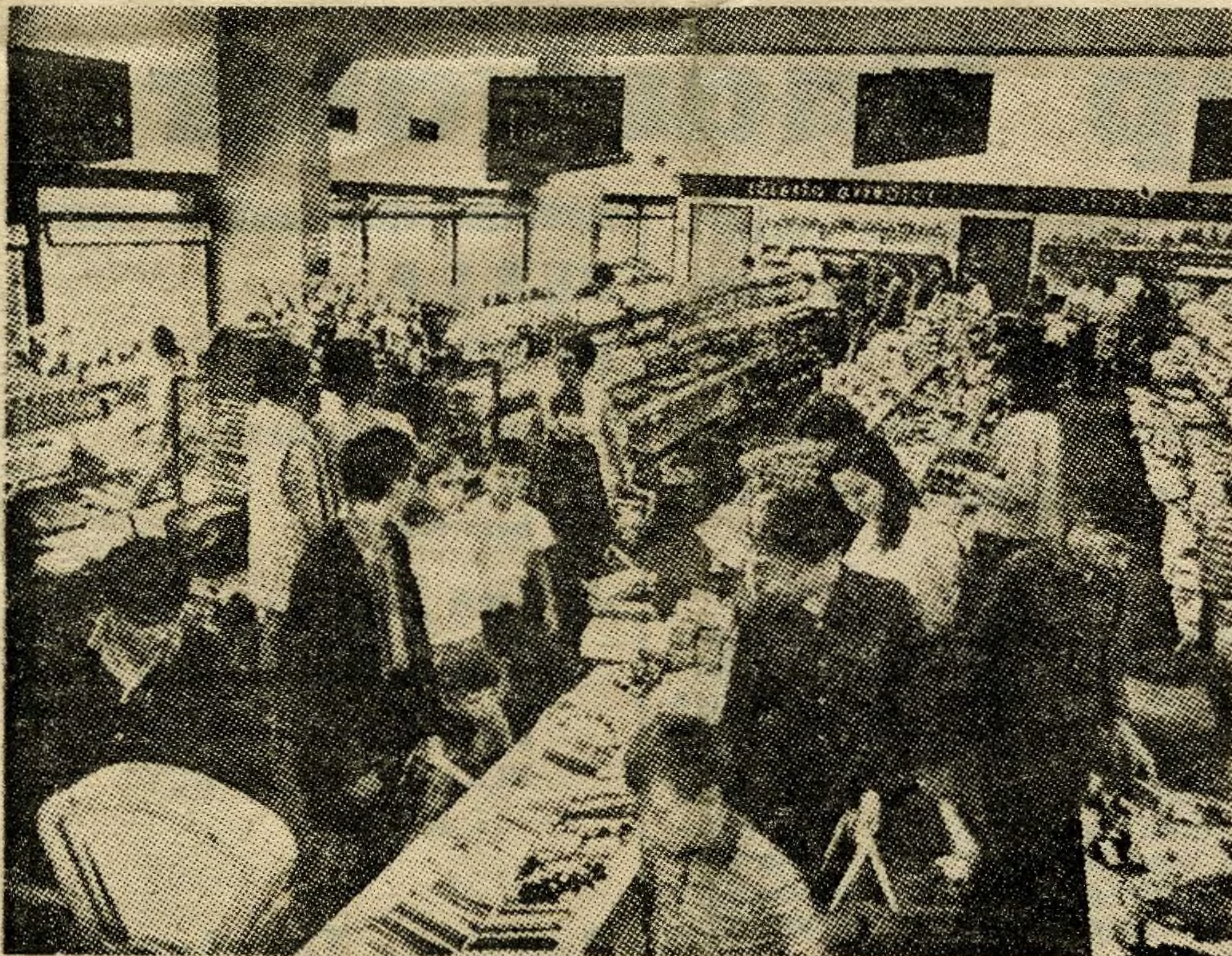
Ook de meer moderne vormen van verkoopstechniek komen thans in Hongarije meer aan bod en zo zijn de supermarkten een steeds meer voorkomend verschijnsel aan het worden.

Economisten rekenen op een periode van 8 tot 10 jaar om een modern technologisch stadium te bereiken, waardoor ook een aanzienlijke optilling van het welvaartspeil mogelijk zal worden. «Telkens men een grote investering doet moet men de tijd laten ze te laten opbrengen,» zo zegt een woordvoerder van de Hongaarse communistische partij.