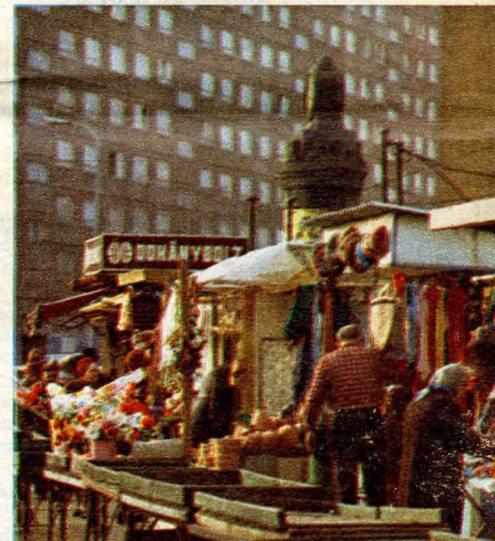
A Kórház utcai piac