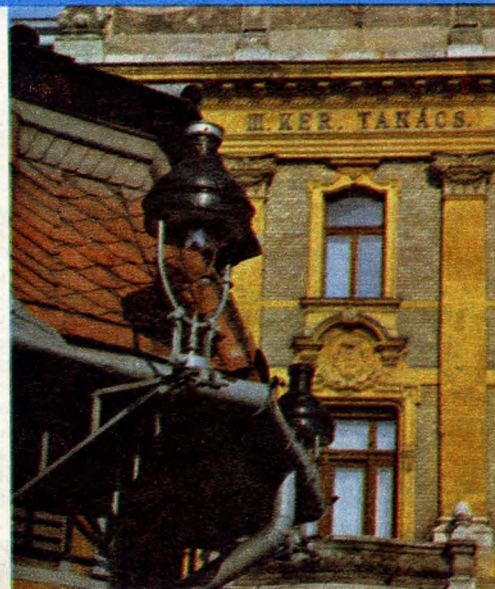
A III. kerületi tanács és a műemlék transzformátorház