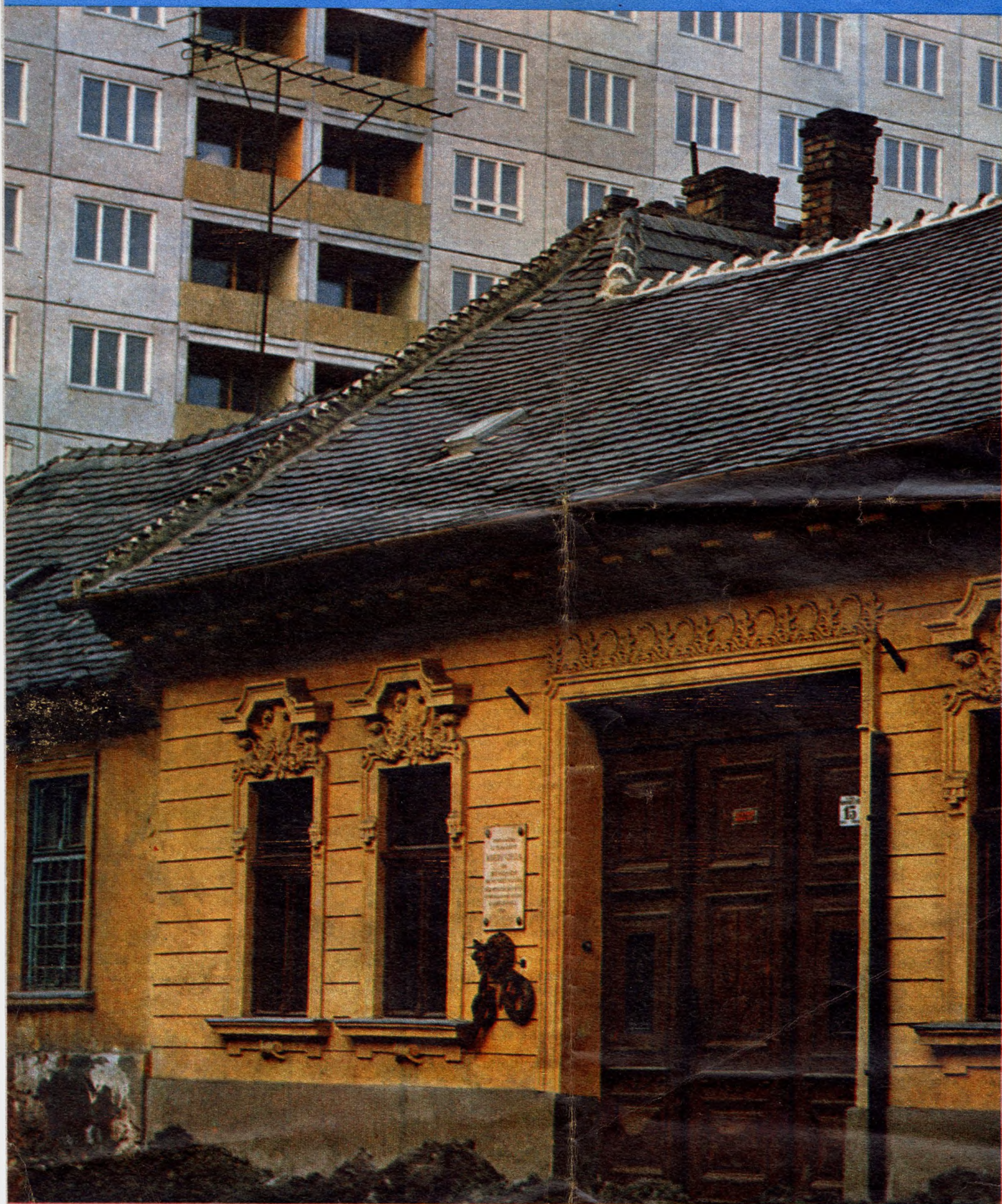
Régi és új találkozása — az előtérben a Krúdy-emléktábla