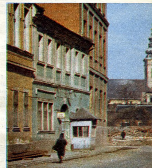
A Goldberger gyár épülete a Lajos utcában