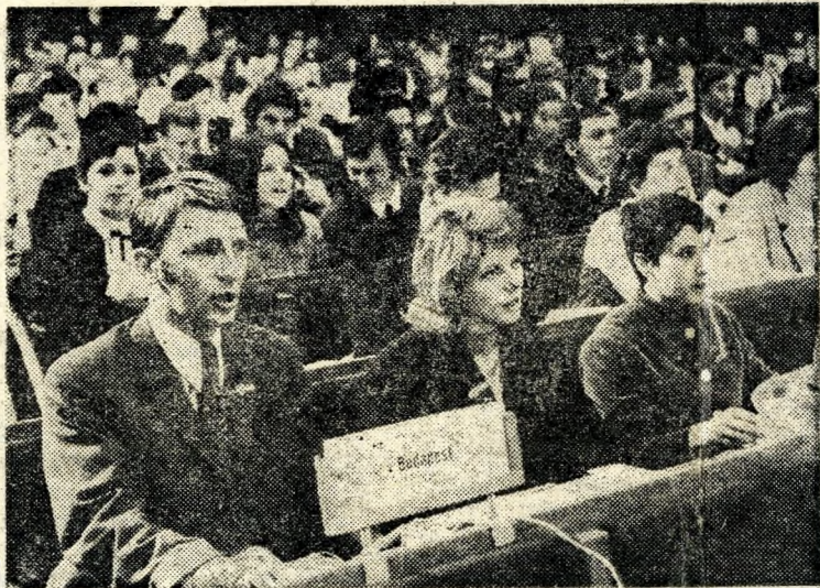
Énekelnek a résztvevők.

(Részletes tudósításunk a 4-5. oldalon.)