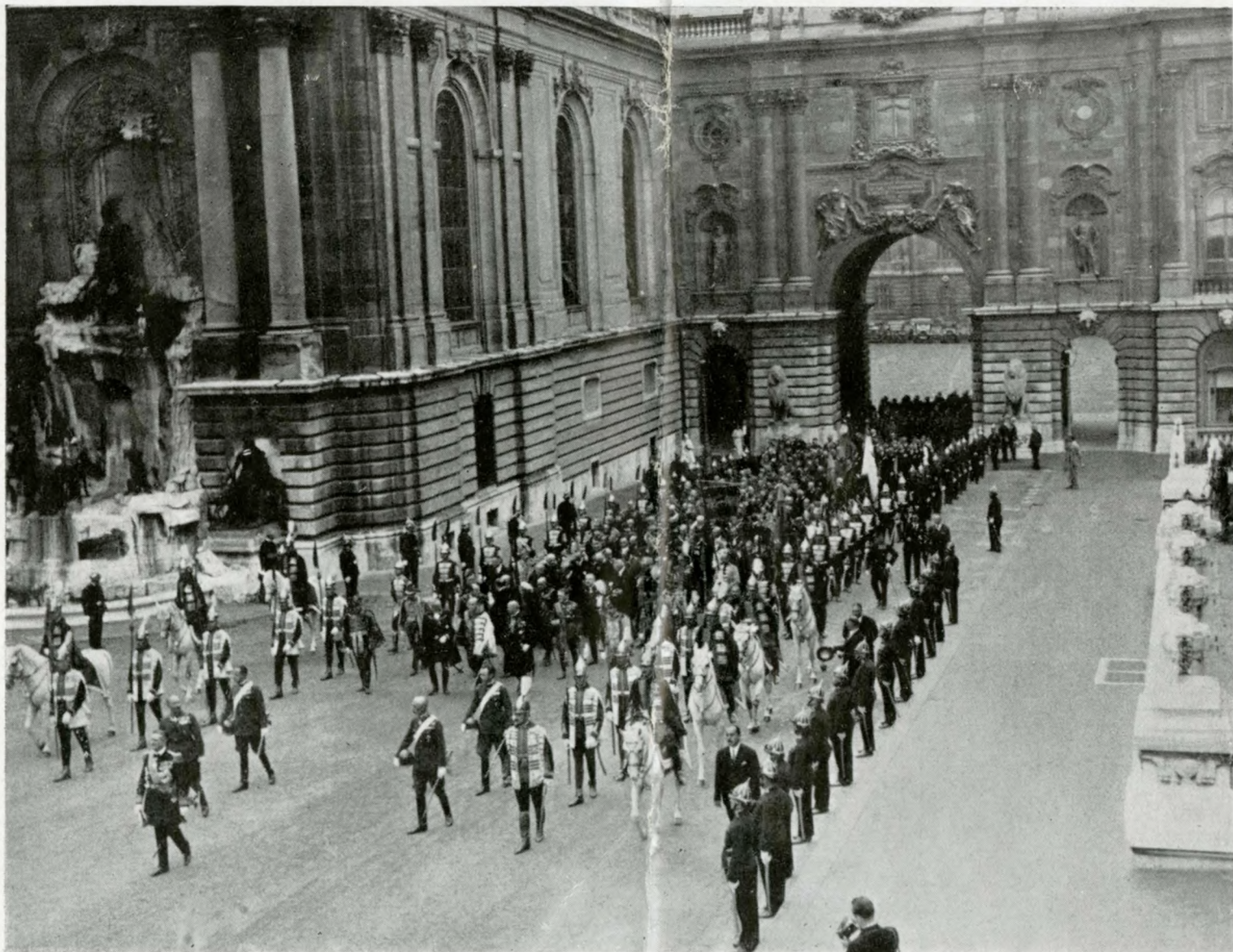
Processione di S. Stefano

Le danze ungheresi di Brahms e le rapsodie di Liszt sono universalmente conosciute. A Budapest se ne possono studiare i motivi fondamentali, perchè quasi in ogni ristorante e caffè vi è musica di zingari. Ma non manca