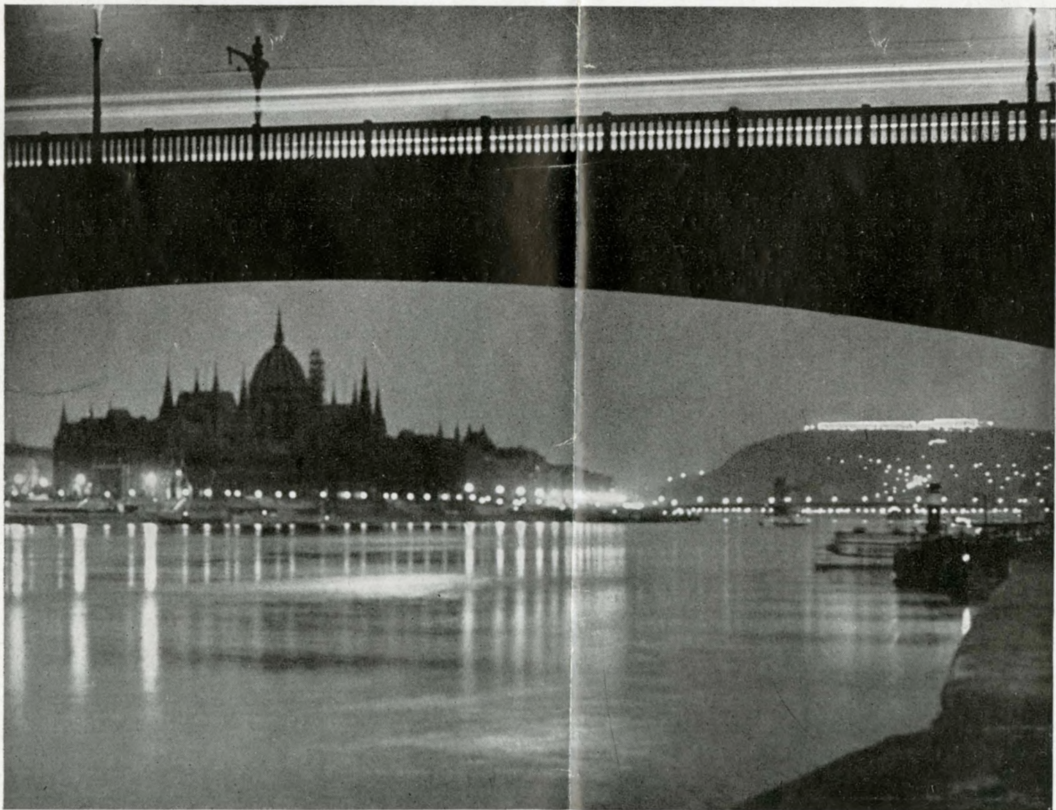
Danubio di notte

Cinque ponti uniscono le due sponde fiancheggiate da magnifici viali. Quel tratto che si stende fra il centenario ponte sospeso ed il ponte Elisabetta, allacciante le due sponde con un unico slancio ardito, si chiama il Corso. Qui si allineano gli alberghi di gran lusso e le gremite terrazze dei caffè; tutt'intorno echeggia la musica e ferve la vita gaia. Incantevole è la vista dell'altra riva, dove si alza ripido il monte San Gerardo, dove i tetti del palazzo reale scintillano nel sole e nello sfondo si snodano lievi colline sparse