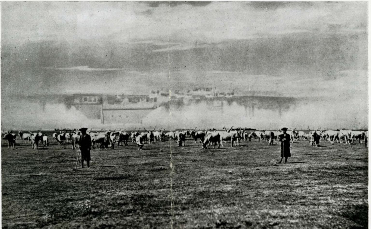
(rovesciare la fotografia)

Più distante è Hortobágy, con una superficie di 287 chilometri quadrati, l'ultima steppa d'Europa. Qui i pascoli immensi si stendono fino all'orizzonte: l'ampiezza maestosa ed il perfetto silenzio della natura esercitano un irresistibile incanto. Qualche volta si osserva lo spettacolo della fata morgana,