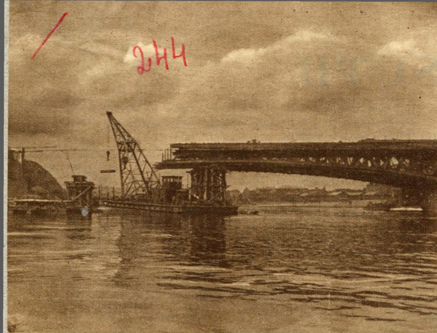
A híd íve rohamosan közeledik a parthoz