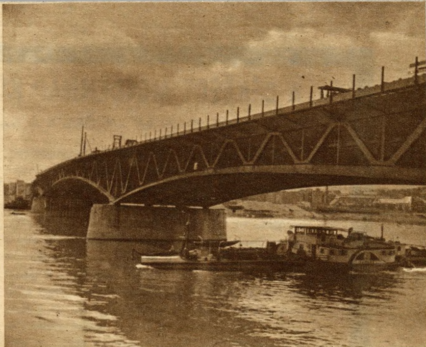
Budapest déli kerületeit köti össze a Petöfi-híd