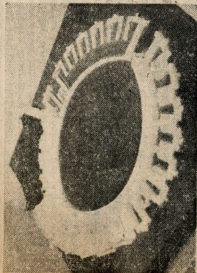
Az őbudai egykori amfiteátrum makettje.

idomtégla és az abból készült vakablak. A kiállításnak talán a legszebb példánya a XV. századból származó kőkonzolépületartó elem — művészi szépséggel faragott leányfejalakja. A múzeum munkaközössége tekintettel volt a telephely egész történelmére, a feudális középkor