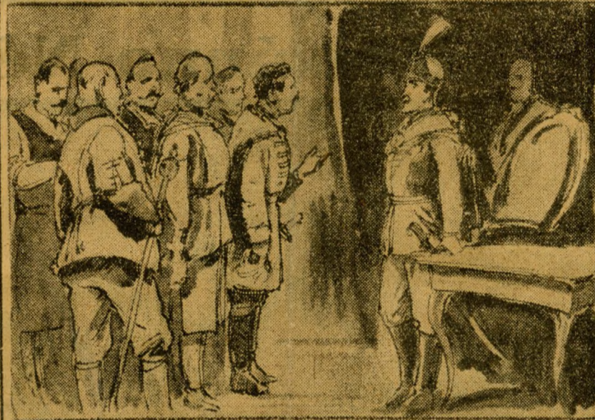
Pesti küldöttség a nádor előtt a bordságítás ügyében.

„Tegnapelőtt dél felé borult egünk kitisztult s a tavaszi nap meleg sugarai földünket csakhamar felszikkasztván, tájazatunkra fényt derítve. Kedvezvén az évenként húsvét másodnapján tartatni szokott népinneprnek, Gellért hegyére mindjárt déltájban kezdve két testvér városunkból (Pestről és Budáról) tömerdek nép gyűlt egybe. Mit nem tesz a szokás izlésünkre, gondolám, midőn e népinnepr nagy tömegében tologva, még oly szépséglét se veheték észre, mely a gyülekezést azon örömet fejezte volna ki, melyet a kikelet megnyíltán érezni lehet.“ Szóval a helyszínrre kiment honművészkolléga nehézményezte, hogy honfi-