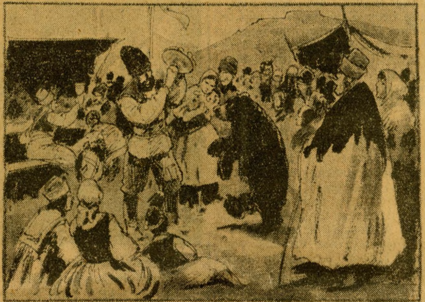
Húsvéti népinnepegy a Gellérthegyen, medvetáncoltatással.

Nagy muri volt ez 1815-ben, éppen húsvét vasárnapján, amikor fölavatták a híres Gellérthegyi csillagvizsgálót. Erdemes, szép intézet volt ez, amely ott állott a Ci-