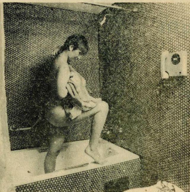
★ Egy fürdőszoba, telefontal

Szuperkomfort és szuperluxus jellemzi az elsősorban nyugati üzletemberek számára épített, s saját szolgáltatásokat kínáló budapesti Atrium Szállodát (a legfelső szinten „Regency klub”, azaz különklubos, extra-szolgáltatásos részleg, idegen nyelveket beszélő, a vendégek kívánságát leső csinos hostessekkel, „joejsza-