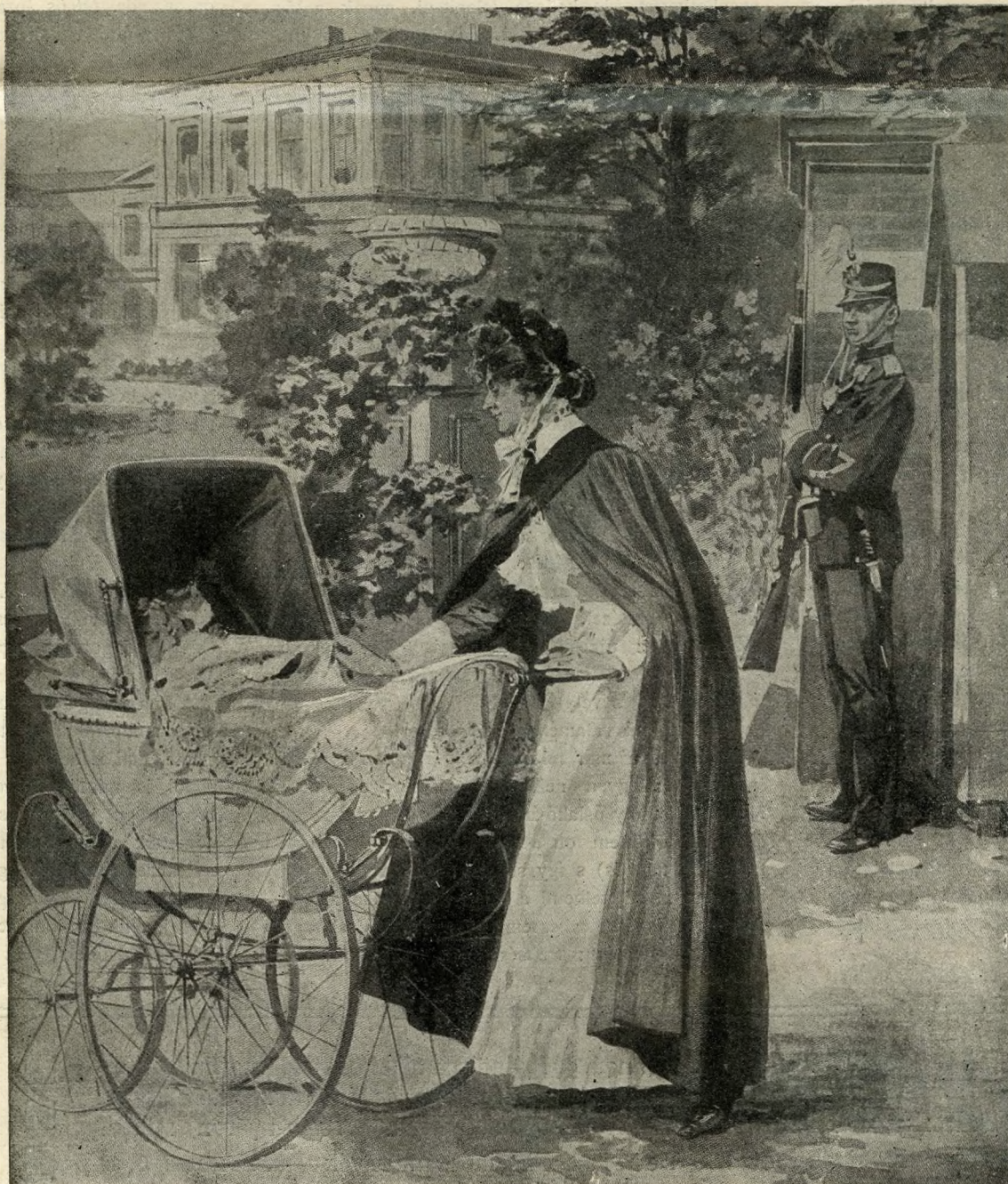
Hollandia kéthónapos trónörökösnőjének első katonai üdvözlése.