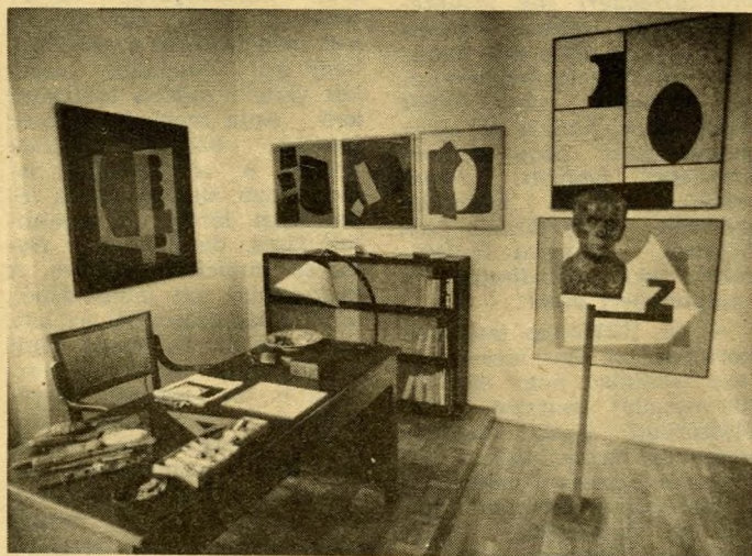
Részlet a Kassák-múzeumból