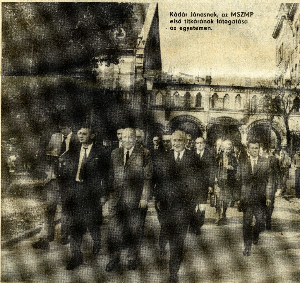
Kádár Jánosnak, az MSZMP első titkárnak látogatása az egyetemen.

az oktatókat, de ismerek más példákat is. Tapasztalatból tudom, hogy nálunk a politikai kultúra elsajátítására is vannak oktatói törekvések. Mi azt szeretnénk, hogy a hallgatók a leendő munkahelyi környezetüknek ne csak passzív résztvevői legyenek. Abban viszont a KISZ-nek is megvan a feladata, hogy a képességek kifejlődjenek! A BME-ről kikerülő mérnökök akkor tanúsítanak majd fejlesztő, divatos szóval innovatív magatartást a munkahelyükön, ha már itt az egyetemen is közéleti emberként viselkednek, viselkedhetnek, sőt így kell viselkedjenek, mert ez a társadalmi környezet — itt az egyetemi környezet — elvárása: vegyenek részt a dolgok intézésében, a KISZ-szervezetet keresztül az egyetemi, politikai közéletben. Ehhez — a hallgatók többségében — megvan a képesség. Ebben a helyzetben nagy az ifjúsági szervezet, a KISZ-titkár felelőssége. Hadd meséljem el, mire kell vigyázni például egy KISZ-titkárnak. Néhány éve — az őszi mezőgazdasági munka kötelezővé válása idején — almaszüretre mentek a hallgatók. Egy darabig szállásmesterként, munkavezetőként, érdekvédőként — mindeneképp — én voltam velük. A rektor kölcsönadta a hivatali kocsiját. Indultam én is. Naponta 16 helyszínen folyt a „műsor”, vitakoztam, átkozódtam, könyörögtem, szóval közvetítettem a gazdaság vezetői és a hallgatók között. Kora hajnaltól késő estig rohangáltunk kertről kertre, szálláshelyről szálláshelyre. A hallgatók közül jó néhányan csak azt jegyezték meg: „Ez az az ember, aki semmit nem