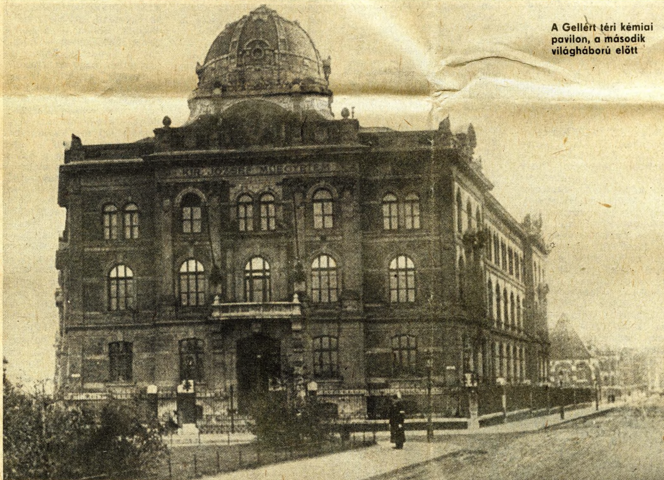
A Gellért téri kémiai pavilon, a második világháború előtt