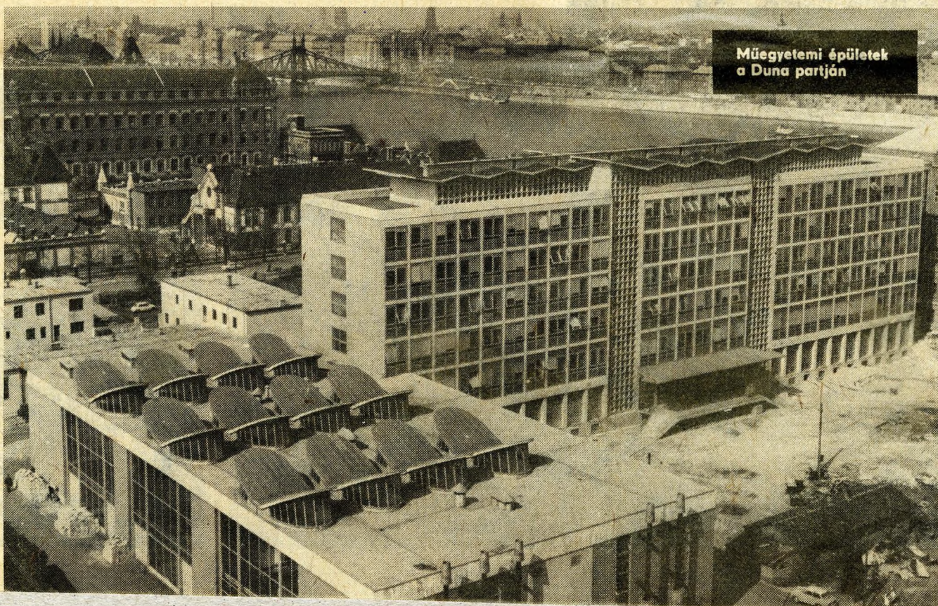
Műegyetemi épületek a Duna partján

„Etsi universim summam sit necessitas studii...”