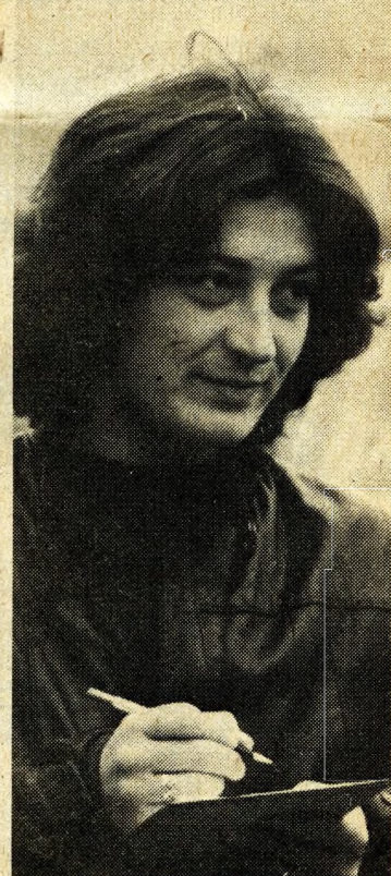
A hazánkban tanuló külföldi diákok közül is sokan járnak a BME-re