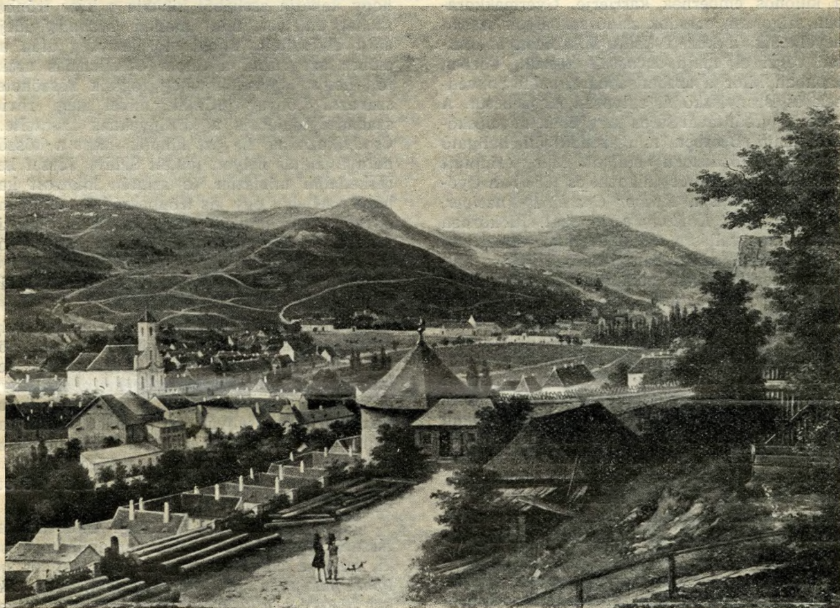
A budai Vérmező tája az 1850-es évekből

emeletes filagória). Majd megtekintjük a Kékgolyó ucca 13. számú háza kapualjának menyezetét angyalfejes diszítésű festésével, s végül egy házzal odébb, a 15/b. számnál, a Pongrácz grófok régi kuriáján álló színes Nepomuki szt. János-szobrot tekintjük meg; szinte felérzik ennek a környéknek pietisztikus, templomhangulatos illata, aminőnek egykor Lenau is érezhette... Krammer Lajos