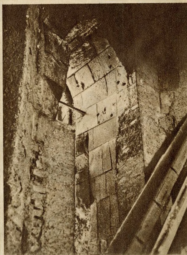
Gót ablakrész a helyőrségi templomban.