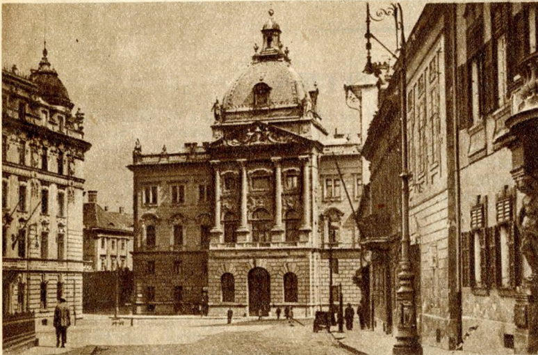
A honvédelmi minisztérium.

A mai honvédelmi minisztérium helyén állott a csász. kir. várórség épülete. Rideg kasszárnya volt ez, körülötte ágyuk ásítottak és szuronyos strázsa sétált föl-alá, rémítgetve a jó budai polgárokat. Még régebben, az osztrák uralom előtt, Mátyás király idejében itt, a mai Disz-téren rendezték a fényes ünnepeket és a lovagi tornákat. Ezért is maradt meg a neve: Disz-tér. A minisztérium helyén.