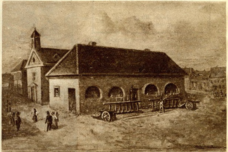
A honvédelmi minisztérium helyén gabonarakta állt.

jött, szépen elsétált a hid közepe, hogy utat nyisson. A hajóhidat különben is csak nyáron lehetett használni, télen felszedték, hogy be ne fagyjon, így azután a jó budaiak vagy pestiek várhattak tavaszig a vizekkel, addig elzárta őket egymástól a Duna.