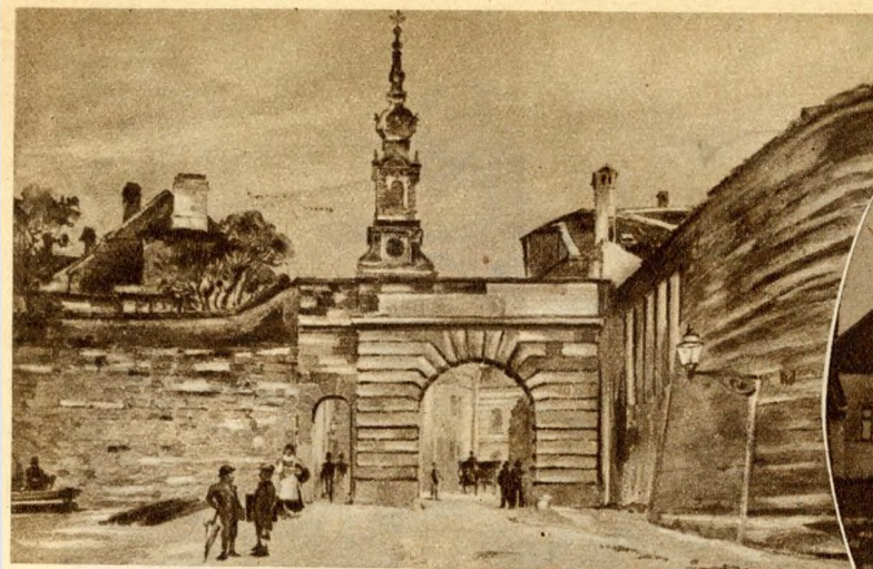
A Bécsi-kapu hajdan és most.

akkor emelvény állott, amelyen Mátyás és a kísérete foglaltak helyet és nézték végig a gyakran halálos kimeneti párviadalokat. És itt egzecirozott a vasfegyelméről híres fekete sereg is.