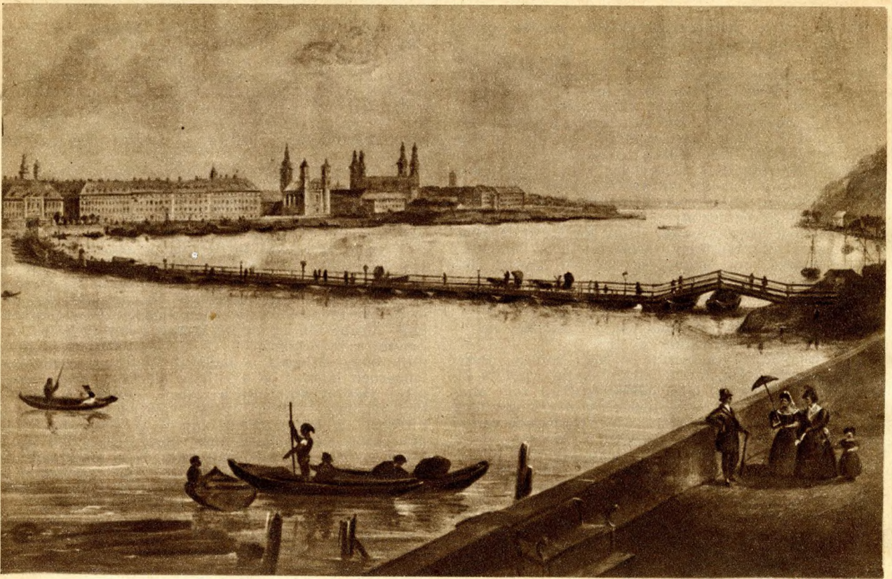
A Lánchíd őse, a pest-budai hajóhid.