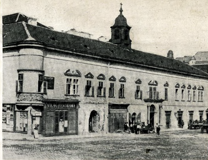
A piaristák háza, amely lerombolás alá kerül. Építették 1705-ben

Azokról is van egy adatunk, akik reggelenként könyvekkel léptek be a régi és távozó pesti ház kapuján. Akik e boltozatos folyosókon, a termék padjaiban töltötték ifjú éveik délelőttjeit. Akik bizonyos büszkeséggel mondhatták és mondják magukról, hogy ők „piarista-tanítványok“. Nem számítva a legrégibb névkönyveket, amelyek elvesztek, százhuszezen vannak, akik itt jártak, itt tanulták az „első latint“, rövidnadrágosan, s kijöttek, mint felnőtt ifjúk. Százhuszezer embert számláló névsor, akik közt felekezeti és társadalmi különbség nélkül találhatók egyszerű polgárok, mesteremberek és arisztokraták fiai. Ha ehhez hozzátesszük a szintén piarista vezetés alatt állott „nemzeti főelemi iskola“ negyvenezer növendékét: valóban egy egész darab Magyarország ez, amibe a piaristák tanításának gyökere nyulik. A legbeszédesebb adat, hivatásuk mellett, amit betöltöttek régi rezidenciájuk