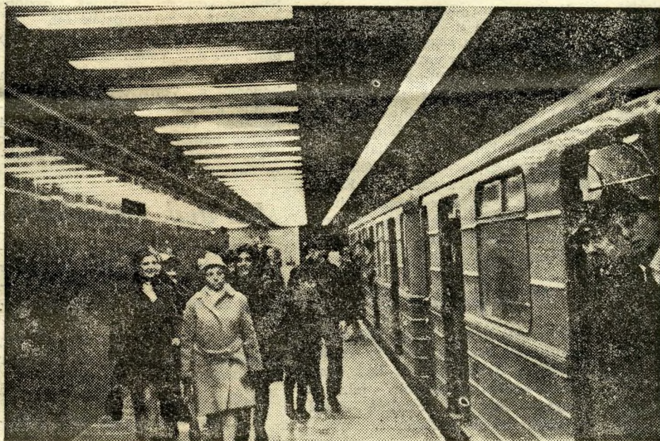
Az első utasok