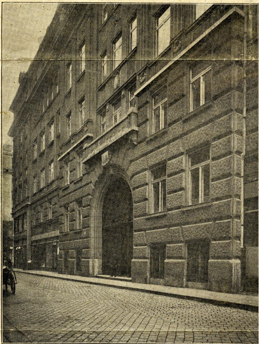
12. A főgimnázium homlokzata.

tárgyává tétetett, hogy nem lenne-e tanácsos a III. emelet elkészülte után az építkezést a háború befejezéséig félbe hagyni. De a rendkormány — miután a pénzüzetekkel megállapodott abban, hogy a vállalkozók heti kereseti kimutatásainak kifizetésére a szükséges összegeket kiadják — az építkezés rendes folytatása mellett határozott, mert tartani kellett attól, hogy a vállalkozók szerződéseiket fölmondják, s ha a háború után az építkezés folytatását meg kellene kezdeni, az új szerződések már csak jelentékenyen nagyobb követelésekkel lennének megköthetők. Így is az első szerződés alapján a vállalkozók igen nehéz helyzetbe jutottak, mert a háború kitörése óta úgy az építő anyagok