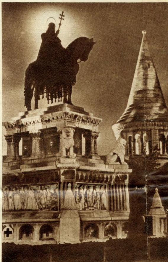
Il monumento di Santo Stefano illuminato di notte