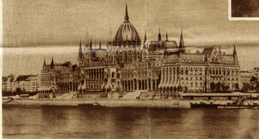
Il palazzo del Parlamento

il Castello, i Bastioni ed il Palazzo Reale splendevano nelle loro architetture diverse sotto il fascio bianco dei riflettori. In basso, nelle acque argentee del Danubio si riflettevano i tre colori della bandiera ungherese (che sono i nostri stessi colori) ripetuti con mille ghirlande e grappoli di lampadine in ogni caffè, ogni albergo, ogni vapore galleggiante, ogni imbarcadere. Sembrava di assistere ad una féerie teatrale, ad un sogno incantato; anche la luna, rossa e tonda come un globo cinese, si divertiva a nascere tra i ricami ferrei del ponte sospeso di Elisabetta, proprio come in una stampa romantica dell'800!