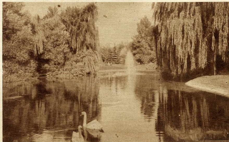
Un angolo del parco pubblico

Qualche cosa di lei ricorda in certi momenti Venezia estiva. Le rive del Danubio, là dove s'aprono le mille luci magate dei suoi grandi hotels, hanno ben qualche riscontro con la nostra riva degli Schiavoni. E' vero ch'io sono arrivata a Budapest nella sera del plenilunio di maggio quando la città cominciava ad accendersi di tutti i suoi lumi e sulla collina di Buda