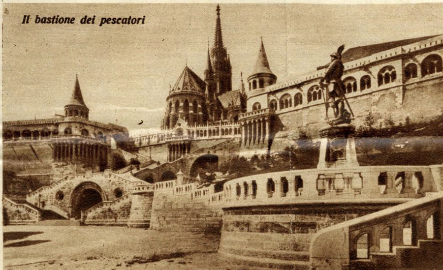
Il bastione dei pescatori

in quella deliziosa Margaretenis (isola Margherita) che è un solo immenso giardino verde adagiato nelle acque azzurre del fiume. Eleganti stabilimenti balneari e termali, tea rooms all'aperto con musiche deliziose, piazze di golf e di polo, si alternano alla bellezza della natura per offrire al pubblico ricco e signorile